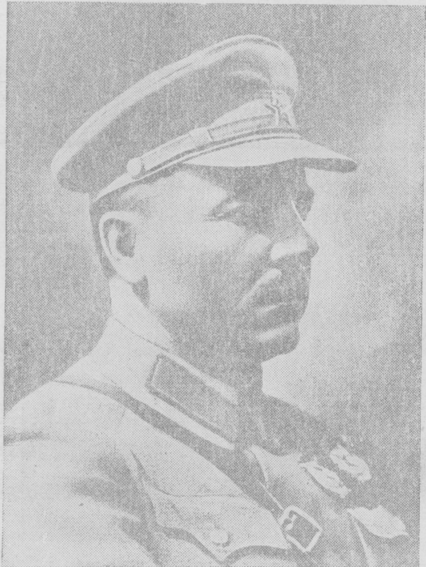
Тов. Н. Е. ВОРОШИЛОВ