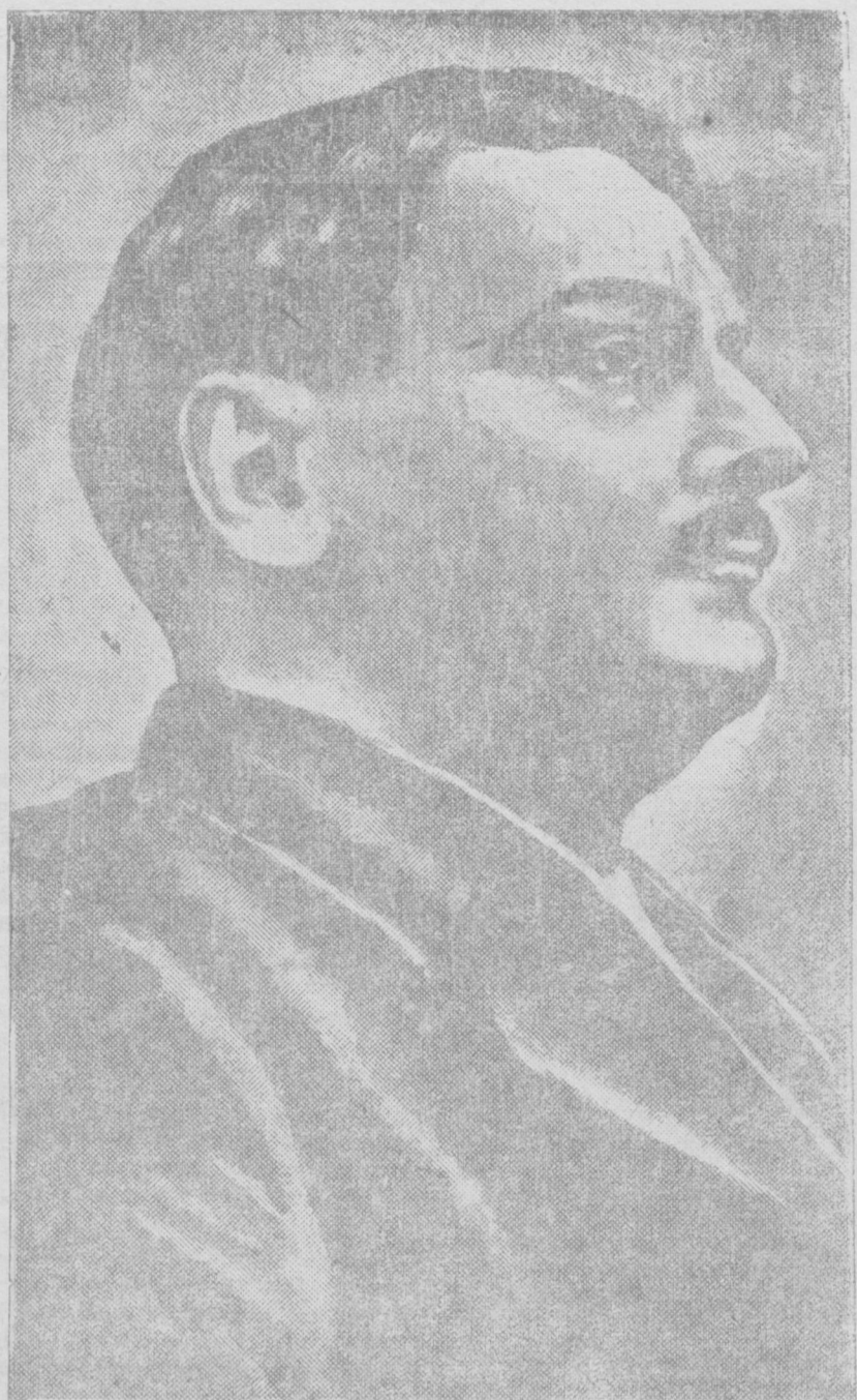
Товарищ А. А. Жданов