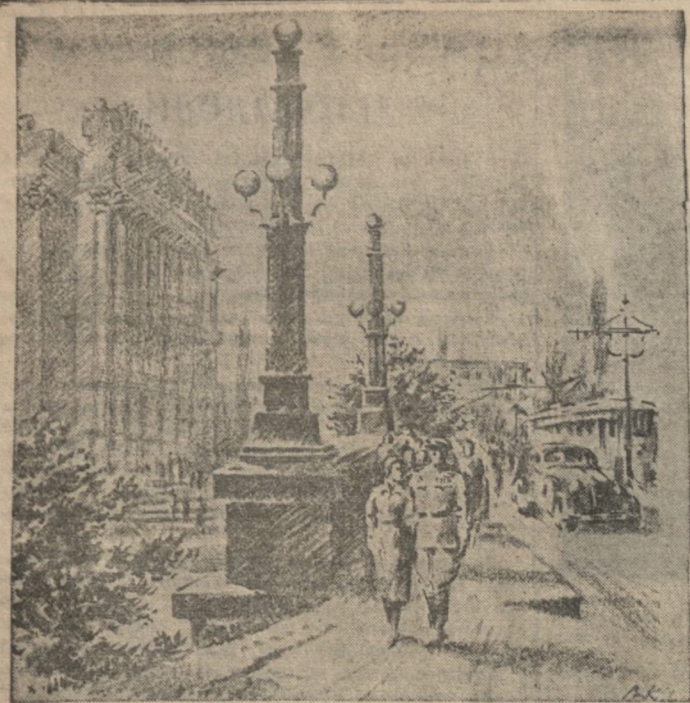
Зарисовки художников В. Кайдалова и М. Рейха.