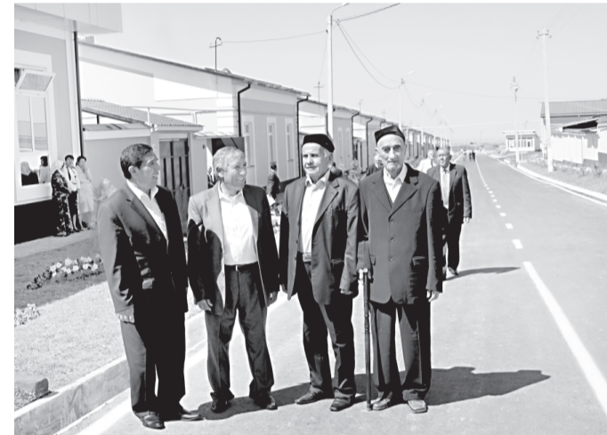
«Гулбоғ»да намунавий лойиҳа асосида қурилган уйлар, уларда яратилган шароит ва қулайликлар мени ҳайратга солди, –

ларда намунавий лойиҳалар асосида уй-жойлар қуриш йўлида бошланган саъй-ҳаракатлар давр талаби эканлиги шубҳасиз. Қишлоқлардаги бунёдкорлик ишлари кўламининг бекиёс кенгайтиши муносабати билан замонавий қурилиш индустрияси шаклланиши ва ривожланиши, янги-янги иш ўринлари очилади, аҳолининг тўлиқ бандлиги таъминланади, оилалар даромади ва турмуш фаровонлиги юксалиб боради. Ушбу бунёдкорлик ишлари натижаси ўлароқ қишлоқларимиз қиёфаси кўз ўнгимизда тубдан ўзгариб, аҳолининг ҳаёт тарзи ва ўй-фикрлари кескин ўзгариб бормоқда.