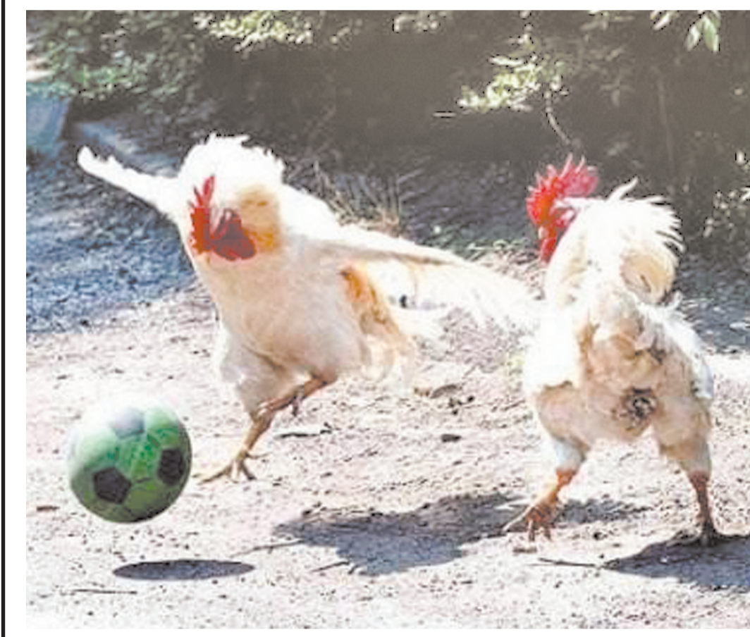
Чемпион бўлман десанг, ҳозирдан ҳаракат қил!