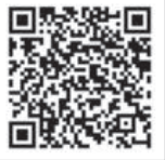
УШБУ МАТЕРИАЛНИ ЛОТИН ЁЗУВИГА АСОСЛАНГАН ЎЗБЕК АЛИФБОСИДА УҚИШ УЧУН МАЗКУР QR-KODНИ СКАНЕР ҚИЛИНГ.

Миллат соёиёти, унинг бирлиги, буюк давлатчилик арконлари мустақамлигини таъминловчи куч бизнинг миллий идеалларимиз ва халқимизнинг унга содиқлик даражасидир. Ўз миллий қадриятларимиз, миллий-маданий меросимизга суянган ҳолда дунёнинг ривожланган давлатлари ва халқлари тажрибасини ўрганиш, келажакка соғлом тафаккур билан қараш асосида танланган ижтимоий мўлжалимиз минг йиллар давомида шаклланган ҳамда бугун тараққиётнинг янги талаблари асосида бойиб бораётган маънавий идеалларимиз билан уйғунлаштириш, шубҳасиз, мамлакатимизни янада ривожлантиришда, халқимизни янги марраларга олиб чиқади.