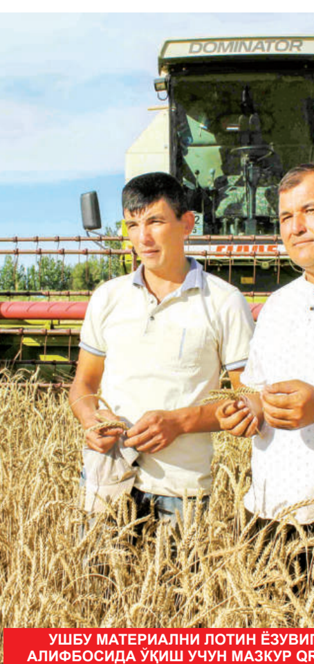
УШБУ МАТЕРИАЛНИ ЛОТИН ЁЗУВИГА АСОСЛАНГАН ЎЗБЕК АЛИФБАСИДА ЎҚИШ УЧУН МАЗКУР QR-КОДНИ СКАНЕР ҚИЛИНГ.

Такрорий экиндан қарийб 12 миллион тонна маҳсулот Юқорида айтганимиздек, айтиш керакки, бу борада ҳуқуқий асос ўлароқ, муҳим аҳамиятга эга бўлди. Негаки, мазкур қарор ғалла етиштирувчилар, жумладан, фермер хўжалиқларининг моддий манфаатдорлигини мустаҳкамлаш ва шу асосда ғалла ҳосилдорлиги ҳамда унинг ялпи ҳажмини кескин оширишга йўл очмоқда. Қарордаги энг муҳим жиҳатлардан бири — ун маҳсулотлари 2022 йилнинг 1 июнидан, ғалла маҳсулотлари эса 1 июлидан бошлаб очiq биржа савдоларига қўйилиши белгилаб берилди. Бундан ташқари,