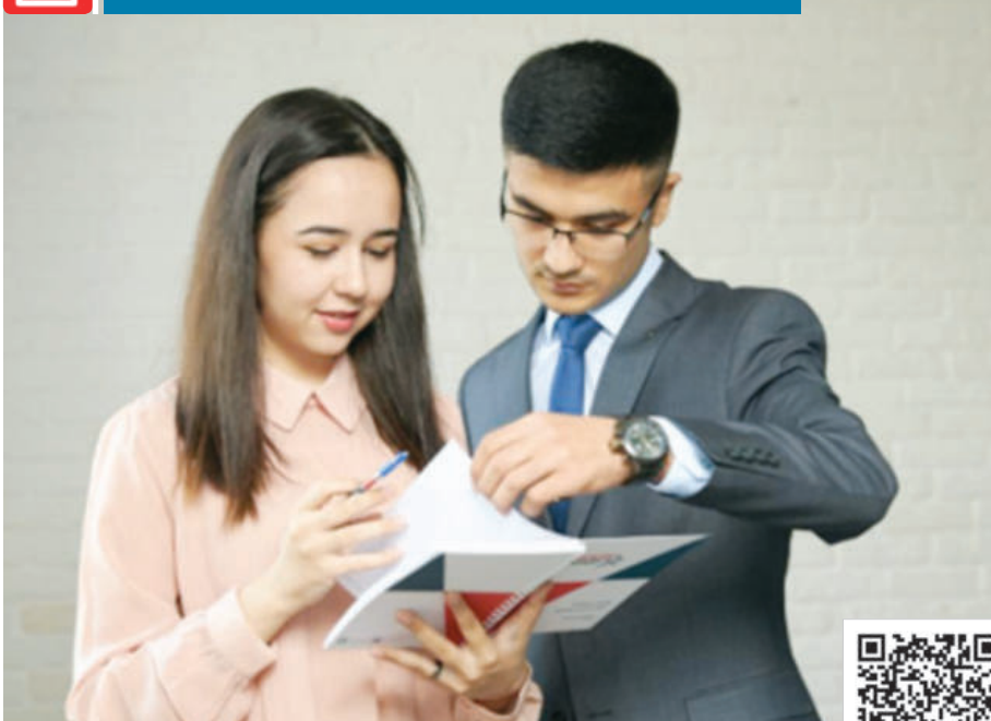
УШБУ МАТЕРИАЛНИ ЛОТИН ЁЗУВИГА АСОСЛАНГАН ЎЗБЕК АЛИФБОСИДА УҚИШ УЧУН МАЗКУР QR-KODНИ СКАНЕР ҚИЛИНГ.

ли, талабаларнинг ҳар бирига индивидуал ёндашиб, ўз мутахассислиги бўйича ишга жойлаштиришга алоҳида ургу берилди.