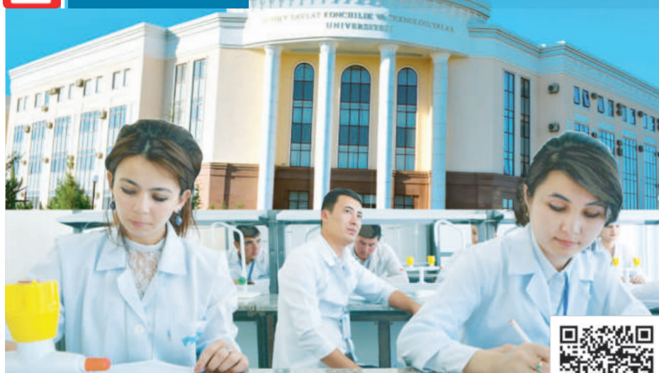
УШБУ МАТЕРИАЛНИ ЛОТИН ЁЗУВИГА АСОСЛАНГАН ЎЗБЕК АЛИФБОСИДА УҚИШ УЧУН МАЗКУР QR-KODНИ СКАНЕР ҚИЛИНГ.

Навоий давлат кончили ва технологиялар университети мамлакатимиз тоғ-кон саноти учун малакали мутахассислар тайёрлайдиган нуфузли олий таълим муассасаларидан бири ҳисобланади. Юртимиз олий даргоҳлари рейтингда 5-ўринни эгаллаб турибди. Ушбу таълим масканда 2000 йилда икки ярим минг талаба таҳсил олган бўлса, бугунги кунда бу кўрсаткич саккиз ярим мингга етди. Талабаларга 300 дан зиёд малакали педагог таълим бериб келяпти. Уларнинг 29 нафари дан доктори, 121 нафари фан номзоди илмий даражасига эга.