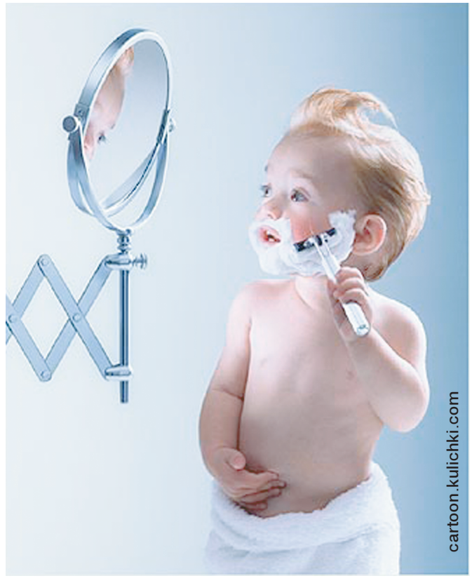
Тезроқ катта бўлсам...