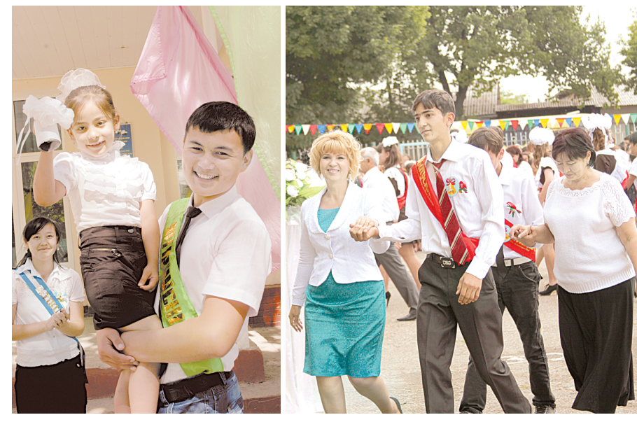
СУРАТАЛАРДА: Янгиғўл туманидаги 61- ҳамда Чиноз туманидаги 1-умумтаълим мактабларида ўтказилган сўнгги қўнғироқ тадбирларидан лавҳалар.