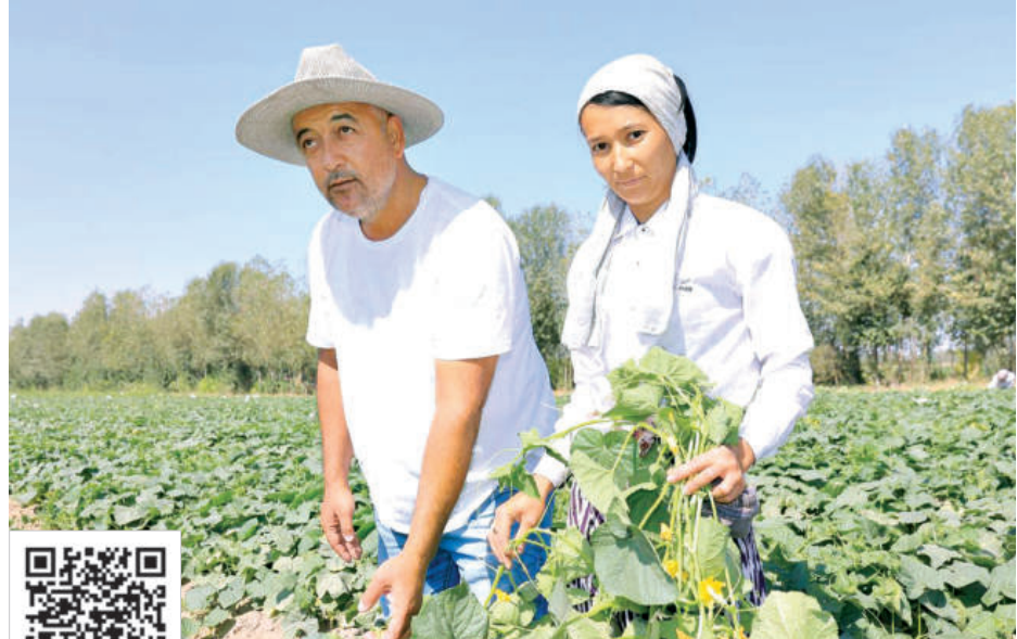
УШБУ МАТЕРИАЛНИ ЛОТИН ЁЗУВИГА АСОСЛАНГАН ЎЗБЕК АЛИФБОСИДА УҚИШ УЧУН МАЗКУР QR-КОДНИ СКАНЕР ҚИЛИНГ.

Аслида, йилнинг қайси бир даври бўлмасин, халқимиз ерга ўзгача меҳр билан қараган. Шу боис, бободехқон қалб кўри билан етиштирган неъматлар йил бўйи дастурхонимиз, бозорларимиз тўкинлиги