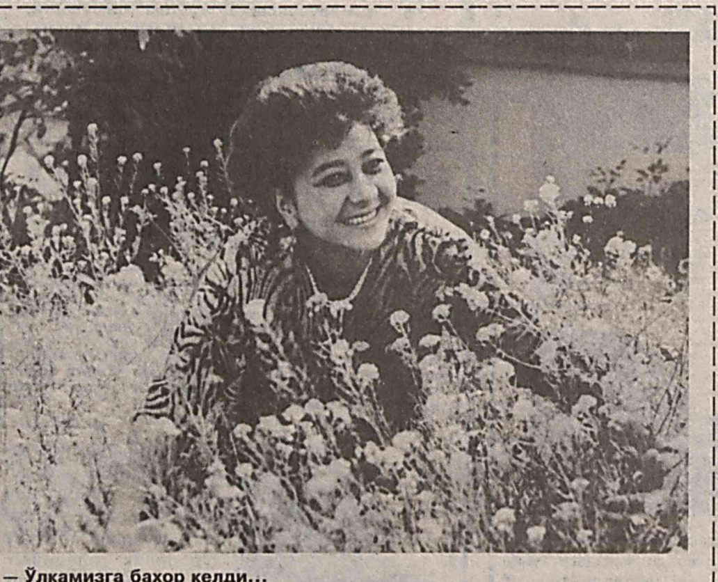
— Ўлкамизга баҳор келди...