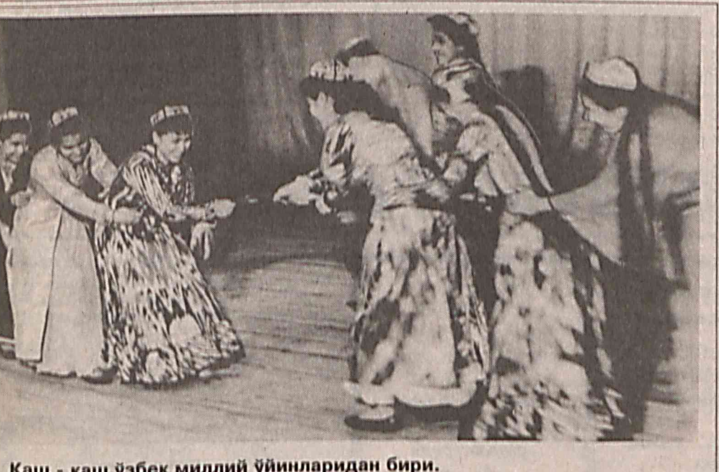
Каш - каш ўзбек миллий ўйинларидан бири.