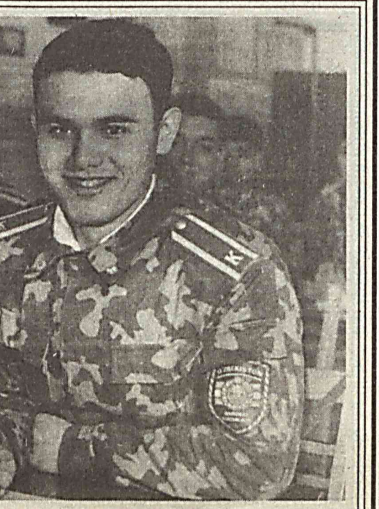
Яқинда ўзининг 8 йиллигини нишонлаган Ватанимиз ҳимоячилари соҳибқирон Амир Темур бобомизнинг: «Аскарлари бакуват эл қудратли бўлур, қудратли элнинг аскарла-