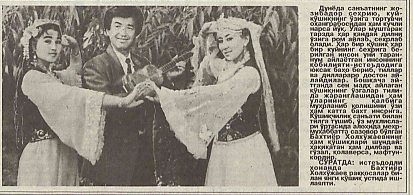
Дунёда санъатнинг жозибдор сеҳрину кўчиқкиннинг ўзига тортувчи охангросидан ҳам кучли нағса йўқ. Улар муштарак тарзда ҳар қандай дилни ўзига ром айлаб, сеҳрлаб олади. Ҳар бир кўшиқ ҳар бир кўннинг сеҳрига берилган инсон уни таранун айлаётган инсоннинг қобилияти-истеъдодига юксак баҳо бериб, тиллар ва диллараро дoston айтадилар. Бошқача айтаданда сен маъд айлаган кўшиқнинг ўзгалар тилида жаранглашадан ҳам уларнинг қалбига муҳрланиб қолишини ўзи ҳам катта бахт ҳисоблайди. Қўшиқчилик санъати билан тилга тушиб, ўз муҳлислари ўртасида алоҳида меҳри-муҳаббатта сазовор бўлган Бахтиёр Холхўжаевнинг ҳам кўшиқлари шундай: ҳақиқатан ҳам дилбар ва гузал қолаверса, мафтун қорди.

АҚШ давлат хазинаси 5 ва 10 долларлик янги банкнотларни муомалага чиқаради. Янги пулларга Президентлар Аврам Линкольн ва Александр Гамильтонларнинг тасвирилари туширилган.