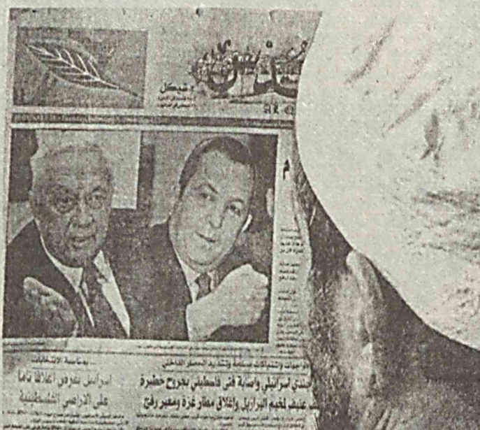
эса сўнги пайтгача мағлубиятга учраши ҳақида ўйлашни ҳам хоҳламаслигини баён қилган.

6 февраль куни Исроилда яшовчи аҳолининг овоз бериш ҳуқуқига эга бўлган 4,6 миллион нафари ҳукумат раҳбарини сайлади. Паластиндаги «Хамас» ташкилоти сайлов пайтида турли террорчилик ҳаракатларини содир этишни эълон қилган, мамлакатда мисли кўрилмаган даражада эҳтиёт чоралари кўрилди. Сайлов пайтида Иордан дарёси чап қирғоғи ва Газа сектори билан бўлган чегаралар беркирилди.