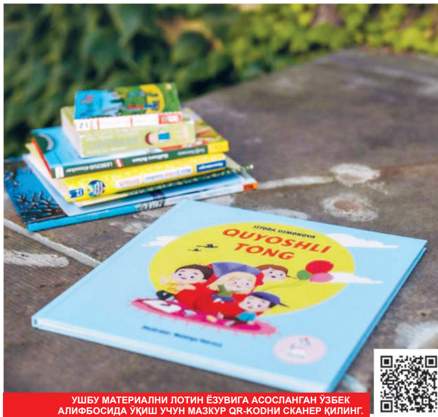
УШБУ МАТЕРИАЛНИ ЛОТИН ЁЗУВИГА АСОСЛАНГАН ЎЗБЕК АЛИФБОСИДА ЎҚИШ УЧУН МАЗКУР QR-КОДНИ СКАНЕР ҚИЛИНГ.

Германияда яшаётган ўзбек болалари учун содда матнли китоб ёзишга киришар эканман, аввалига китоб гоёсини бир қанча немис ҳамда инглиз нашриётларига кўрсатдим. Улардан "бизда ўзбек тилига талаб йўқ, ўзбекча тахрир қиладиган муҳаррир ҳам йўқ" ёки "бизнинг контентимизда одоб-ахлоқ, саломлашиш каби мавзулар ёритилмайди" қабилида жавоб олсам-да, мақсадимдан қайтмадим. Халқимиз боланинг бегонаси бўлмайди, дейди-ку... Ўзбек тилидаги сифатли китобни болаларимизга тақдим қилишни ўйласам, ич-ичимдан хурсанд бўлиб кетардим. Назаримда, шундай қилсам, ватанимга бир қадам бўлса ҳам яқинлашадигандек эдим.