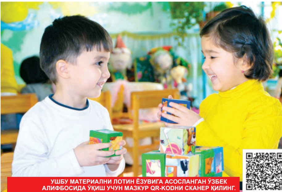
УШБУ МАТЕРИАЛНИ ЛОТИН ЁЗУВИГА АСОСЛАНГАН ЎЗБЕК АЛИФБОСИДА ЎҚИШ УЧУН МАЗКУР QR-КОДНИ СКАНЕР ҚИЛИНГ.

Иккинчи модель ўзини гуруҳлари асосида ишлайди. Бу гуруҳлар 3-7 ёшли болалар учун "Илк ривожланиш маркази"да очилади. Таълим-тарбия жараёни "Илк қадам" давлат ўқув дастурига мувофиқ амалга оширилади, ота-оналар ихтиёр равишида иштирок этса бўлади. Учинчи гуруҳлари мўйайн ёки турли ёшдаги болалардан ташкил топади. Ушбу гуруҳдаги болалар 15 нафардан 20 нафаргача бўлиши мумкин.