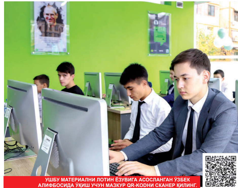
УШБУ МАТЕРИАЛНИ ЛОТИН ЁЗУВИГА АСОСЛАНГАН ЎЗБЕК АЛИФБОСИДА УҚИШ УЧУН МАЗКҮР QR-КОДНИ СКАНЕР ҚИЛИНГ.

Ижтимоий тармоқларда давлат, Конституция, қонунлар ва бошқа ҳуқуқий-меъёрий ҳужжатларга очикдан-очик провакацион муносабатлар