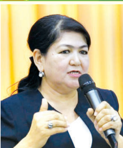
муҳим аҳамият касб этади. Шу боис, мамлакатимизда айнан мактабгача таълим узлуksиз таълим тизимининг ажралмас бўлагига, таъбир жоиз бўлса, пойдеворига айланган.

Илмий кузатиш ва тадқиқотлар натижасида инсон ҳаёти давомида оладиган барча маълумотнинг етмиш фоизини беш ёшгача бўлган даврда олиб улгуриши аниқланган. Бу даврда бола дунёни англайди, она тилини ўзлаштиради, ота-онаси, оиласи, маҳалласи, Ватанига меҳри уйғонади. Умри давомида оладиган билимларига замин ҳозирлайди. Бунда, энг аввало, оила асосий роль ўйнаса, мактабгача таълим ташкилотининг ҳиссаси ҳам муҳим аҳамият касб этади. Шу боис, мамлакатимизда айнан мактабгача таълим узлуksиз таълим тизимининг ажралмас бўлагига, таъбир жоиз бўлса, пойдеворига айланган.