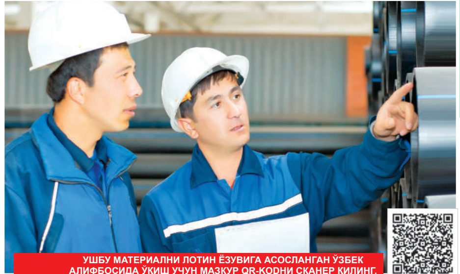
УШБУ МАТЕРИАЛНИ ЛОТИН ЁЗУВИГА АСОСЛАНГАН ЎЗБЕК АЛИФБОСИДА УҚИШ УЧУН МАЗКУР QR-КОДНИ СКАНЕР ҚИЛИНГ.

Сир эмас, коронавирус пандемияси манаман деган давлатлар иқтисодиётини ҳам танг ахлолга солиб қўйди ва бундан Ўзбекистон ҳам четда қолмади. Аммо пандемияга қарамай, мамлакатимизда тадбиркорлик субъектларига шундай имкониятлар яратиб берилдики, бундан