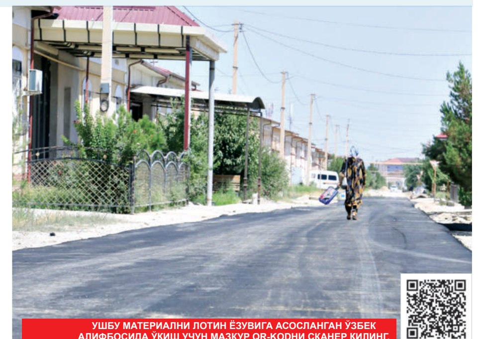
УШБУ МАТЕРИАЛНИ ЛОТИН ЁЗУВИГА АСОСЛАНГАН ЎЗБЕК АЛИФБОСИДА ЎҚИШ УЧУН МАЗКУР QR-КОДНИ СКАНЕР ҚИЛИНГ.

2023 йилнинг ўтган даврида вилоятда барча дастурлар доирасида йўл таъмири учун 248 миллиард сўм ажратилди ҳамда 568,4 километр автомобиль