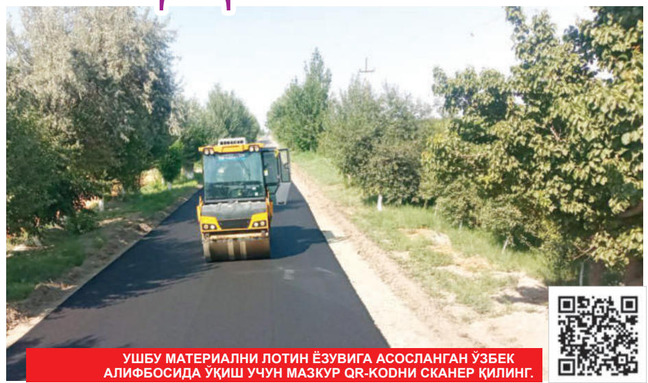
УШБУ МАТЕРИАЛНИ ЛОТИН ЁЗУВИГА АСОСЛАНГАН ЎЗБЕК АЛИФБОСИДА УҚИШ УЧУН МАЗКУР QR-КОДНИ СКАНЕР ҚИЛИНГ.

— Туманимиз маҳаллалари, айниқса, олис қишлоқлар қиёфасини тубдан ўзгартириш, инфратузилмасини яхшилаш, у ерда яшовчи аҳолига қўлайлик яратиш ишлари авжида, — дейди Вобкент тумани ҳокими Фарҳод Умаров. — Ўзбекистон Республикаси Президентининг 2022 йил 25 октябрдаги "2022-2023 йилларда маҳаллалар инфратузилмасини янада яхшилаш бўйича қўшимча чора-тадбирлар тўғрисида"ги қарорига мувофиқ, жорий йилда Вобкент туманида маҳалла ва қишлоқларнинг ички йўллари таъмири борасидаги лойиҳалар учун жами 59,8 миллиард сўм ажратилган. 2022 йил ва 2023 йилнинг июнь ойи якунига қадар