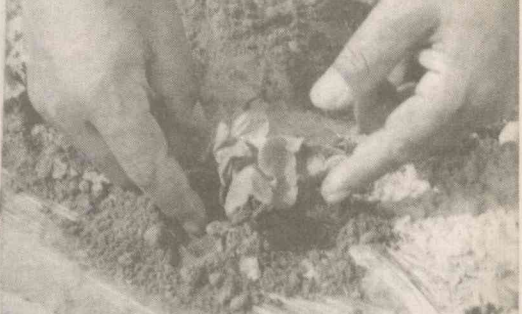
СУРАТЛАРДА: бош ҳосилот Раҳимжон Кодиров пудратқилардан Жалолiddин Гафоров ва Тоҳиржон Исмаилов билан ушиб чикқан ниҳолларни кўздан кеңирмоқда; ушбу ниҳол дехқон меҳри...