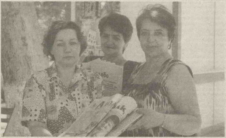
«Самарқанд матбуот уюшмаси» ходимлари ярим миллион нусхадан ортиқ вақтли матбуот нашрларини эгаларига ўз вақтида etkazишади. Ҳозиржавоблик, ишчанлик улар учун хос фазилат. Ҳозир вилоятнинг барча шаҳар ва туманларида уюшманинг ўз бўлимлари очилган ва зарур транспорт билан таъминланган. Бу ерда газета ва журналларга йилнинг қолган 6 ойи учун обуна ҳам уюшқоқлик билан etkazилмоқда.

Ислом ҚАРИМОВ, Ўзбекистон Республикаси Президенти.