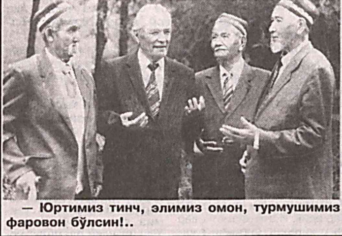
— Юртимиз тинч, элимиз омон, турмушимиз фаровон бўлсин!..