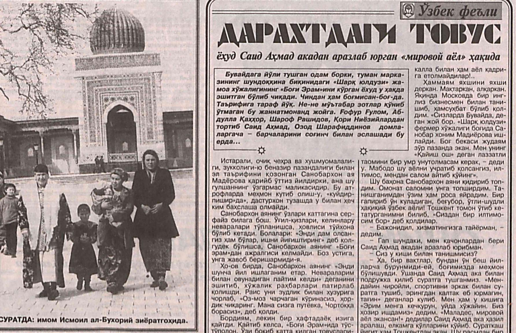
СУРАТДА: имом Исmoil ал-Бухорий зиёратгоҳида.

● НАТО кенгаши Македонияда ўтказилаётган «Қаҳраболо тулки» (Янтарная лиса) операциясининг муддатини уч ойга, яъни 26 июнга қадар узайтириш ҳақида қарор қабул қилди.