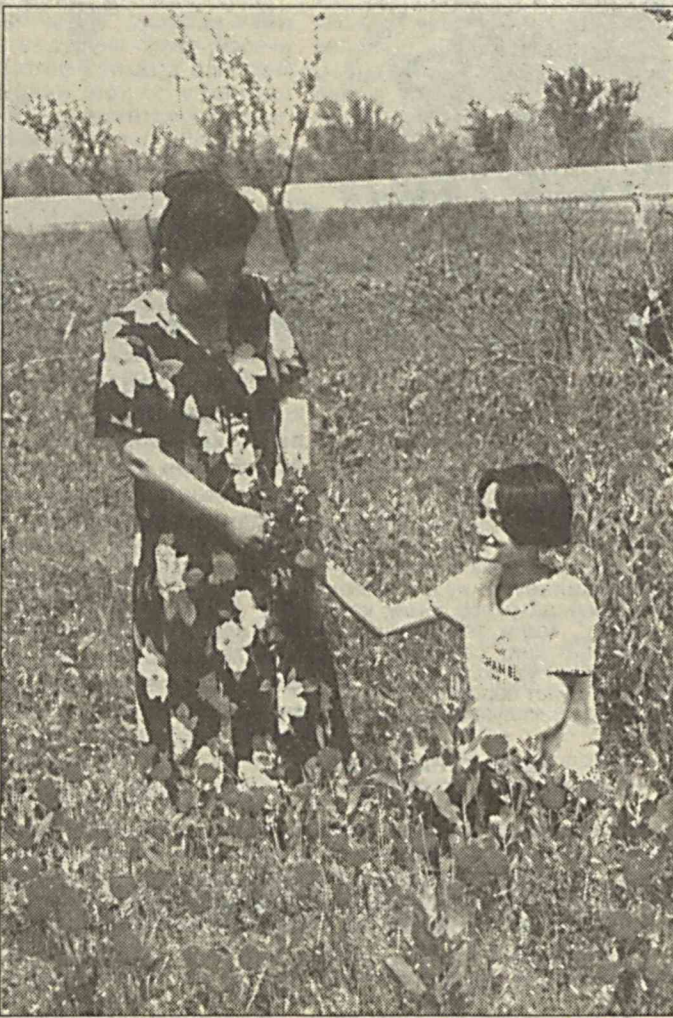
Болам - бағримдаги баҳорим, лолам, - Онам, Сиз-ла ёруғ бу кўркман олам.

ПАНД Дўстсиз яшаш муқиммас, аммо ҳамма ҳам дўстликка арзийвермайди.