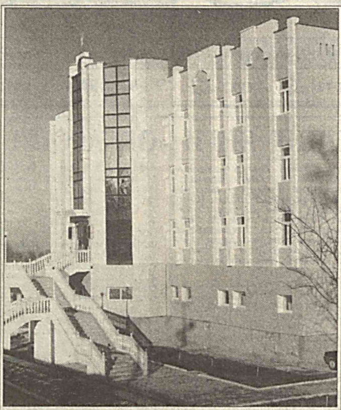
Фаргона тумани солиқ инспекциясининг янги маъмурий биноси.