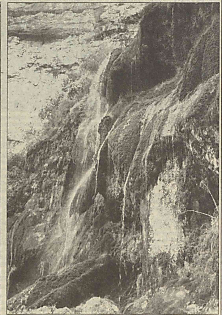
Қиёс қилсам, гўзалликнинг энг сараси - Сангардақнинг ойна кўзли шаршараси.