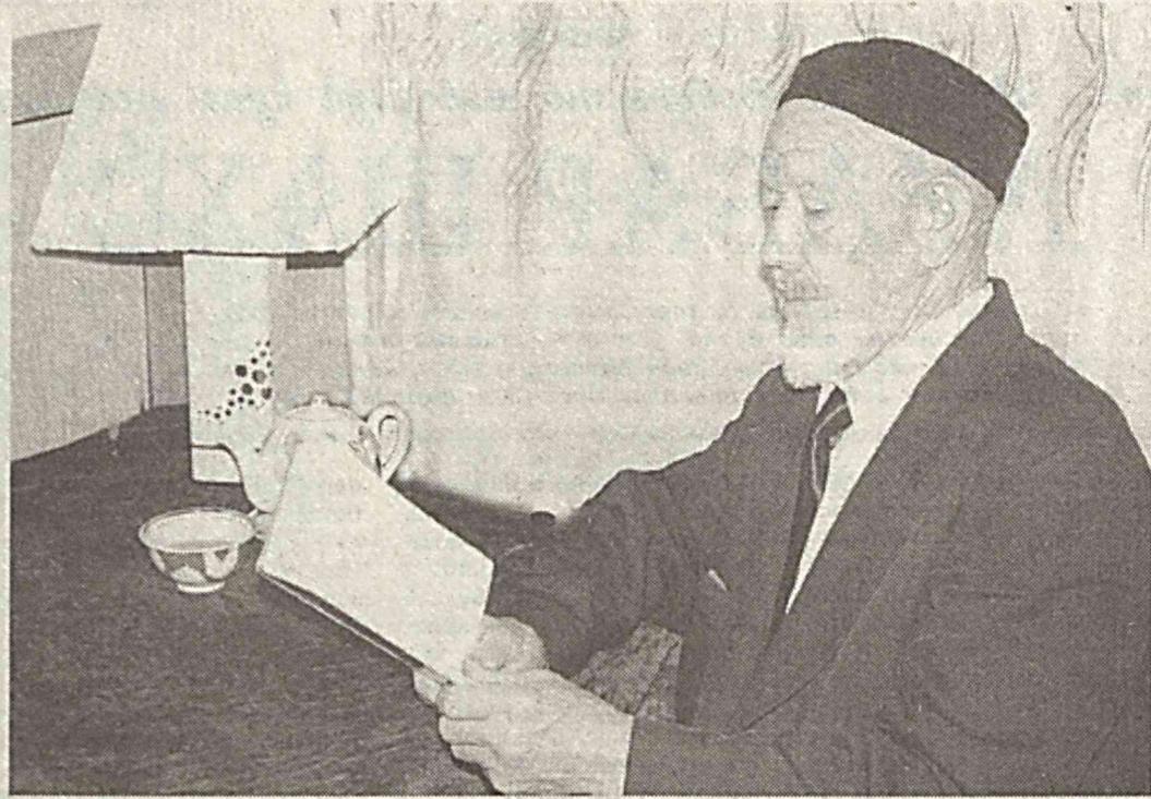
Балки кексалик ҳам донишмандлиқдир, Бунда борми бирон ечилмаган сир, Авлодларга ўрнат — бергучи сабоқ, Боболар ўғити ундан яхшироқ...