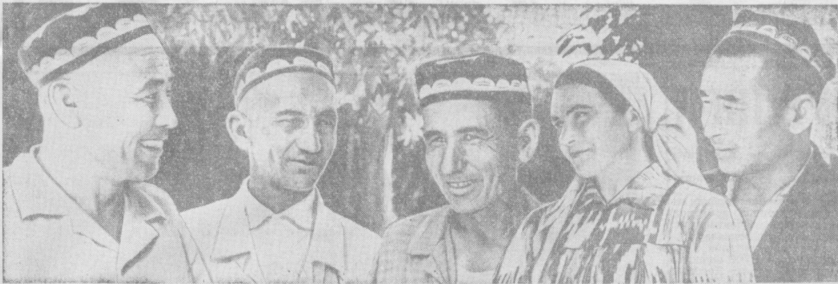
Суратда: кенгаш қатнашчиларидан бир гуруҳи.