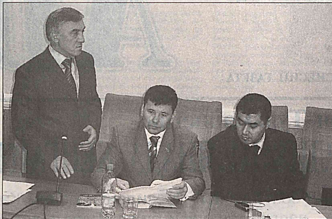
ри томонидан илгари сурилган вазифаларнинг бағоят муҳимлиги ва алоҳида аҳамиятга эга эканлигини кўрсатиб турибди. Ийгилишда “Ўзбекистон Республикаси Фуқаролик процессуал кодексининг 2382-моддасига қўшимчалар киритиш тўғрисида”ги қонун лойиҳаси ҳам қизгин муҳокама қилинди. Муҳокама чоғида фракция аъзолари томонидан қонун лойиҳасини янада такомиллаштиришга қаратилган таклифлар билдирилди. Ўз мухбиримиз Н.ҲАЙДАРОВ олган суратлар.

(Давоми. Боши 1-бетда) “Фуқароларнинг давлат пенсия таъминоти тўғрисида”ги Ўзбекистон Республикаси Қонунга ўзгартиш киритишлар тўғрисида”ги қонун лойиҳасини мана шундай саъй-ҳаракатларнинг узвий давоми ўлароқ баҳолаш мумкин. Қонун лойиҳаси муҳокамаси чоғида, таъкидландики, аҳолининг эҳтиёжманд қатламлари ижтимоий муҳофаза қилиш юзасидан “Ижтимоий ҳимоя йили” Давлат дастури доирасида амалга оширилаётган кенг қўламли тадбирлар, шунингдек, Ўзбекистон Республикаси Президентининг “Аҳолининг ижтимоий ҳимоя қилиш тизимини янада такомиллаштириш ва мустаҳкамлашга оид чора-тадбирлар тўғрисида”ги 2007 йил 19 мартда ҳамда “Пенсионерларни ижтимоий қўллаб-қувватлашни кучайтириш борасидаги чора-тадбирлар тўғрисида”ги 2007 йил 17 сентябрда қабул қилинган Фармонлари давлатимиз раҳба-