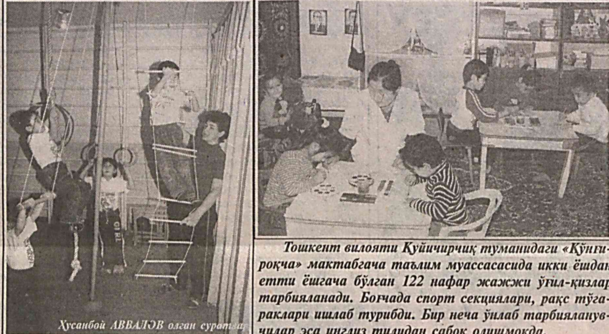
Тошкент вилояти Қўйичирчиқ туманидаги «Кўнжирокча» мактабгача таълим муассасасида икки ёшдан етти ёшгача бўлган 122 нафар жажжи ўғил-қизлар тарбияланади.

Бироқ, ана шу уч ойлик муддатда терговни тамомлашнинг имконияти бўлмаса, Қорақалпоғистон Республикаси, вилоятлар ва Тошкент шаҳар прокурорлари ва уларга тенглаштирилган прокурор томонидан беш ойгача узайтирилади.