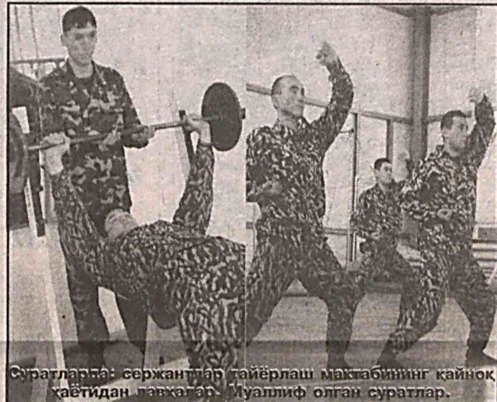
Суратларда: сержантлар тайёрлаш мактабининг кайноқ ҳаётидан лавҳалар.