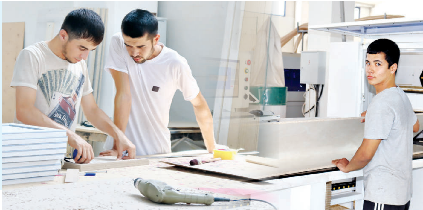
QORASUV — MEBELCHILAR SHAHARCHASI

Hozirgi kunda O'rta Chirchiq tumanidagi Qorasuv, Tinchlik va Fayzobod mahallalaridagi xonadonlarda ishlab chiqarish maydonlari kichik, ularni kengaytirish imkoniyati mavjud emas. Qolaversa, elektr ta'minotida uzilishlar bo'lib turadi. Ishlab chiqarish jarayonidagi uskunalar shovqini