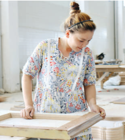
ESAYOTIR YANGI HAYOT NASIMI

Bundan o'n besh yillar burun qorasuvliklar ham yondosh mahallalarda yashovchi tumandoshlari kabi dehqonchilik va chorvachilik bilan shug'ullanardi. Aholi, jumladan, yosh yigit-qizlari ham zovur bo'yalarida sigir boqib, dalada ketmon chopib, shuning ortidan tirikchilik o'tkazardi. Mebelsozlik borasidagi imkoniyat va salohiyat ularga ham sirli, bamisoli ochilmagan qo'riq edi.