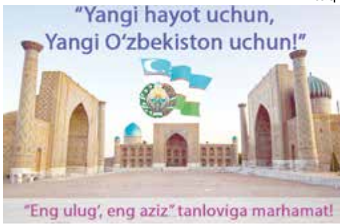
"Eng ulug', eng aziz" tanloviga marhamat!

Tanlovga 2022-yilning 1-avgustidan 2023-yilning 1-avgustigacha bo'lgan davrda rasman chop etilgan adabiy-badiiy asarlari, gazeta-jurnallar va internet nashrlarida e'lon qilingan maqolalar, radio va televideniya kanallarida e'fira uzatilgan materiallar, namoyish etilgan tasviriy san'at ishlari