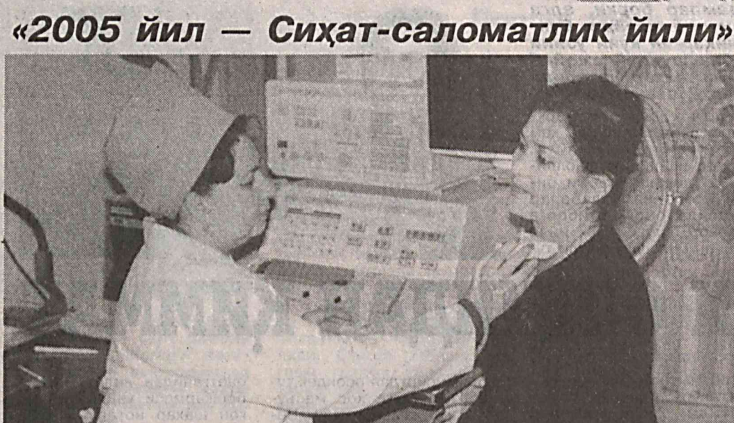
Эл соғлиги — юрт бойлиги.

Футбол бўйича Осиё чемпионлари лигасида навбатдаги учрашувлар бўлиб ўтди. Мусобақанинг «Д» гуруҳида қатнашаётган Тошкентнинг «Пахтакор» жамоаси бешинчи турда Суриянинг «Ал-Жаиш» футболчиларига қарши майдонга чиқди.