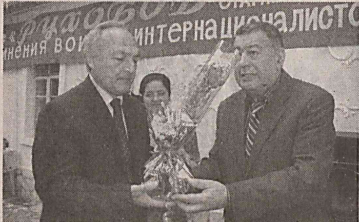
8 май кунин Тошкент шаҳрининг «Ассалому-алайкум» кафедада Узбекистон «Адолат» СДП Сийсий Кенгаши билан Узбекистон Байналминалчи жангчи-фахрийлар бирлашмаси билан ҳамкорликда «Хотира ва қадрлаш кунин» ва Иккинчи жаҳон урушида қозонилган ғалабанин 60 йиллигига бағишланган ҳайрия тадбири ўтказди.