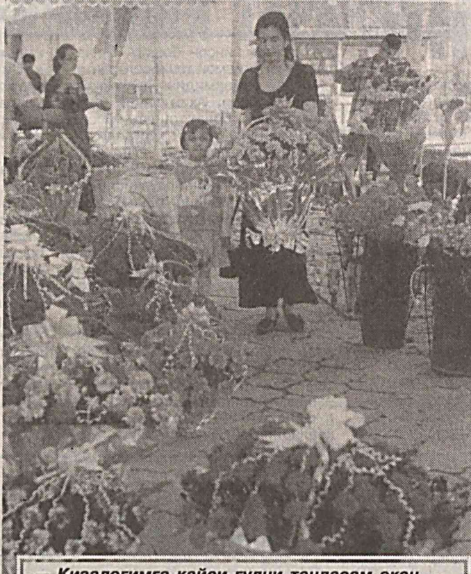
— Кизалоғимга қайси гулни танласан экан...

— Фуқароларнинг жамағариб бориладиган пенсия ҳисоб вақтидаги доимий тартиб рақами берилиши ҳақида ҳам тўхталсангиз. — Шахсий жамағариб бориладиган пенсия ҳисоб вақтидаги доимий тартиб рақами Ўзбекистон Республикаси Вазирлар Маҳкамасининг «Ўзбекистон Республикаси Фуқаросининг шахсий ҳисоб рақамини (шахсий код)ни аниқлаш тартиби тўғрисида»ги 1996 йил 31 майдаги Қарорига кўра таъинланади.