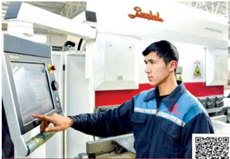
УШБУ МАТЕРИАЛНИ ЛОТИН ЁЗУВИГА АСОСЛАНГАН ЎЗБЕК АЛИФБОСИДА ЎҚИШ УЧУН МАЗКУР QR-КОДНИ СКАНЕР ҚИЛИНГ.

Ҳозирга қадар вилоят бўйича 1 миң 884 тадбиркор дастур доирасида ҳамкорлик қилиш истагини билдириб,