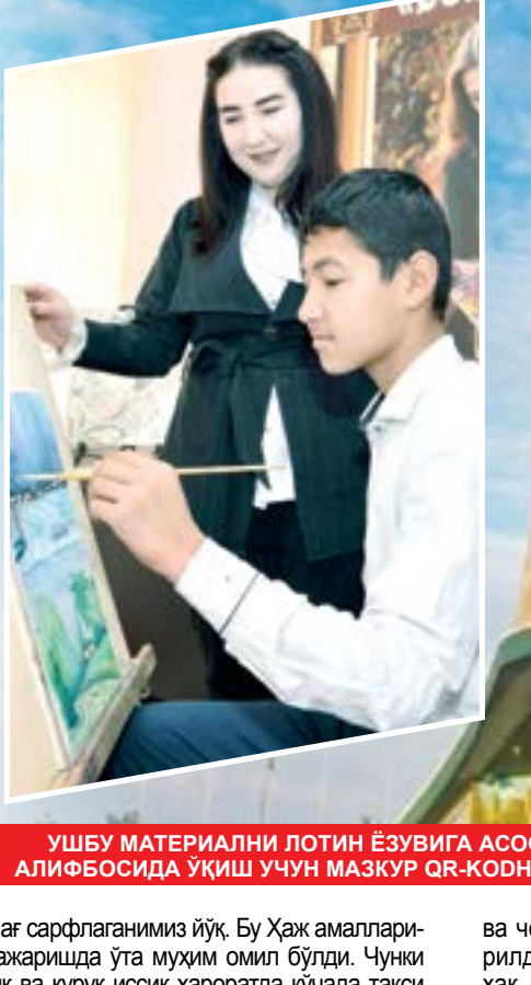
УШБУ МАТЕРИАЛНИ ЛОТИН ЁЗУВИГА АСОСЛАНГАН ЎЗБЕК АЛИФОБАСИДА УҚИШ УЧУН МАЪЗУР QR-КОДНИ СКАНЕР ҚИЛИНГ.

Давлатимиз раҳбарининг юртимизда инсон қадрни ҳамма нарсадан азиз туриши кераклиги туркидаги фикрлари ҳаётга қанчалик татбиқ этилаётганини Ҳаж маросимда ўз кўзим билан кўрдим. Ҳажнинг барча амалларини бажаришга ҳамма автобусларда олиб боришди. Мино, Арафот, Муздалифа каби барча ҳудудларда автобуслар хизматимизга шай турди. Биз транспорт қидиришга вақт ва қўшимча