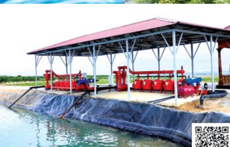
УШБУ МАТЕРИАЛНИ ЛОТИН ЁЗУВИГА АСОСЛАНГАН ЎЗБЕК АЛИФБОСИДА УҚИШ УЧУН МАЗКУР QR-KODНИ СКАНЕР ҚИЛИНГ.

Шу боис, мамлакатимизда қишлоқ хўжалиги экинларини суғоришда сув тежовчи технологиялардан фойдаланишни кенгайтириш, ариқ ва каналларни бетонлаштириш, сув агрегатларини модерни-