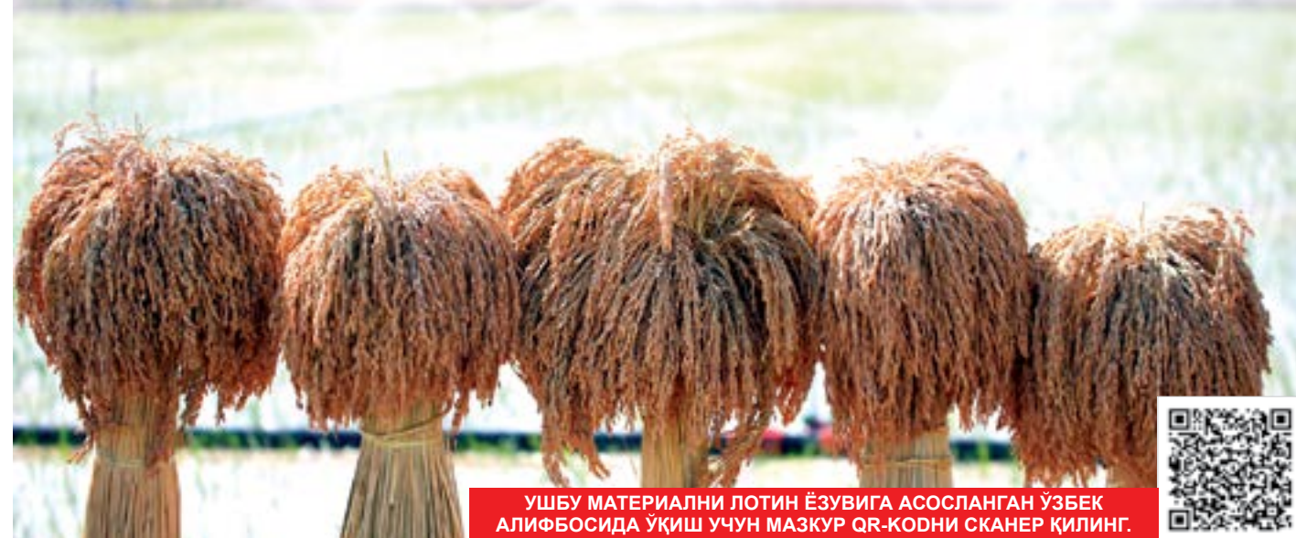
УШБУ МАТЕРИАЛНИ ЛОТИН ЁЗУВИГА АСОСЛАНГАН ЎЗБЕК АЛИФБОСИДА УҚИШ УЧУН МАЗКУР QR-KODНИ СКАНЕР ҚИЛИНГ.

Шундай қилиб, мамлакатимизда йилда икки ёки уч марта шоли ҳосилини олиш тажрибаси синовдан муваффақиятли ўтди, дея оламиз. Энди навбат буни худудларимизда кенг жорий қилиш, бу орқали деҳқон ва фермерларимиз даромадини янада ошириш, халқимизнинг гуруч маҳсулотларига бўлган талабини қондиришдан иборат. Бу йўлдаги изланишларимиз эса давом этади.