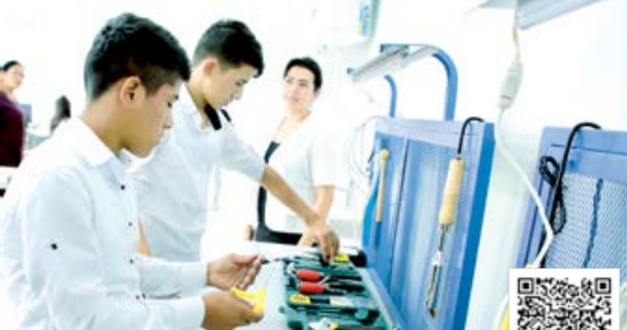
УШБУ МАТЕРИАЛНИ ЛОТИН ЁЗУВИГА АСОСЛАНГАН ЎЗБЕК АЛИФБАСИДА ЎҚИШ УЧУН МАЗКУР QR-КОДНИ СКАНЕР ҚИЛИНГ.

Учинчидан , олий таълим тизимида қамровни 50 фоизга етказиш ва таълим сифатини ошириш давлат эътибори марказида бўлади. Талабаларнинг яшаш шароитини яхшилаш мақсадида 100 минг ўринли талабалар турар жойлари барпо этилади. Давлат олий таълим муассасалари томонидан босқичма-босқич меҳнатга ҳақ тўлаш, ходимлар сони, тўлов-контракт микдори ва таълим шаклини мустақил белгилаш амалиёти йўлга қўйилади ва улар учун ижтимоий солиқ ставкаси 12 фоизга туширилади. 2026 йилгача хусусий олий таълим ташкилотлари сони камида 50 тага етказилиб, уларда таълим олаётган талабаларга ҳам 7 йиллик таълим кредити олиш имконияти яратилади. "Эл-юрт умиди" жамғармаси орқали ёшларни нуфузли хорижий олий таълим муассасаларига ўқишга юбориш кўлами 2 баробар оширилади. Тўртинчидан , таълимнинг барча босқичидаги муассасалар ва уларнинг ходимлари — боғча тарбиячиси, мактаб