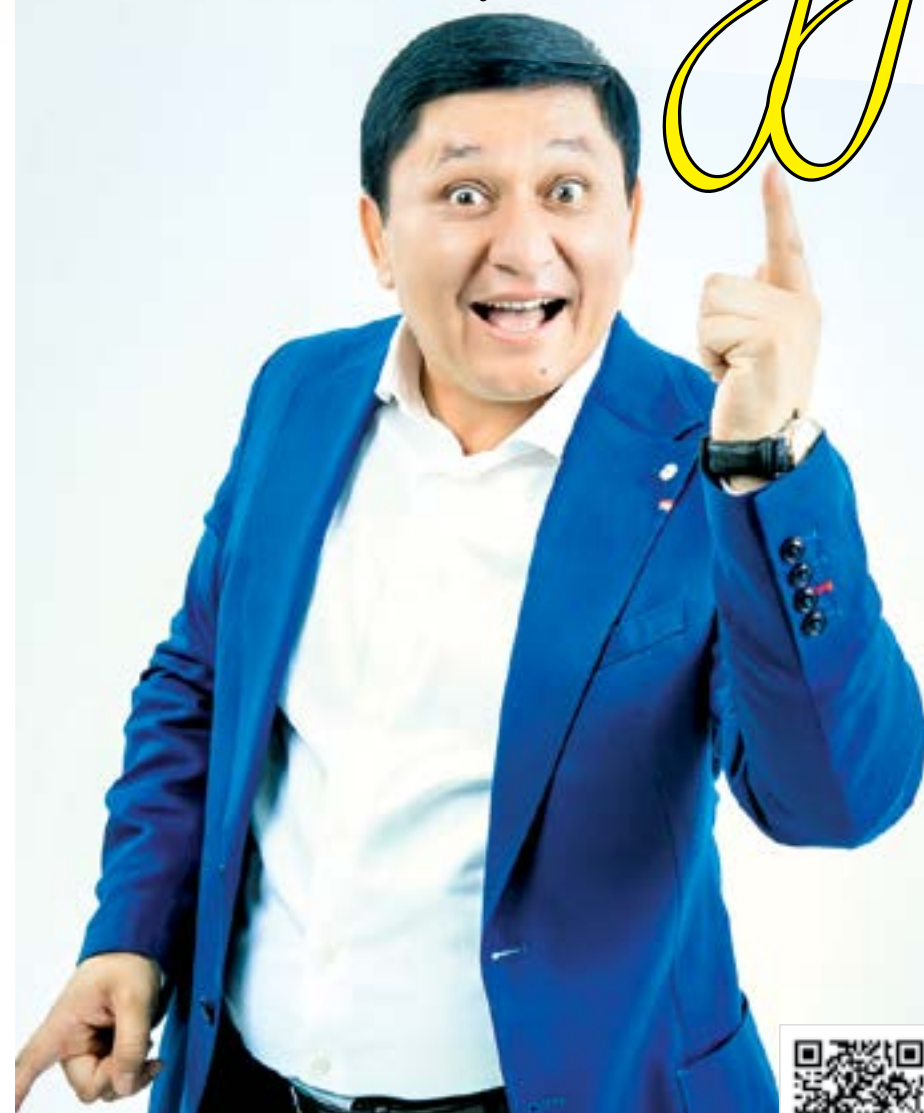
УШБУ МАТЕРИАЛНИ ЛОТИН ЁЗУВИГА АСОСЛАНГАН ЎЗБЕК АЛИФБАСИДА УҚИШ УЧУН МАЗКУР QR-КОДНИ СКАНЕР ҚИЛИНГ.

Илмий асосланган маълумотларга кўра, кунига ўн дақиқа кулиш умрни бир йилга узайтириши мумкин. Кулиш жараёнида юзимиздаги саксондан зиёд мушак қариш жараёнига фаол қаршилик қилишини, кунига 15 дақиқа кулиш бир ойда 2 кило вазн ташлашга кўмаклашиши мумкинлигини биласизми? Кулги терапияси организмнинг иммун тизимини мустаҳкамлаши ҳақидаги фикрни эса Абу Али ибн Синонинг “Бемор кулаётган лаҳзаларида юз фоиз соғлом одам ҳолатида бўлади!” деган жумласи билан қувватлаш мумкин.