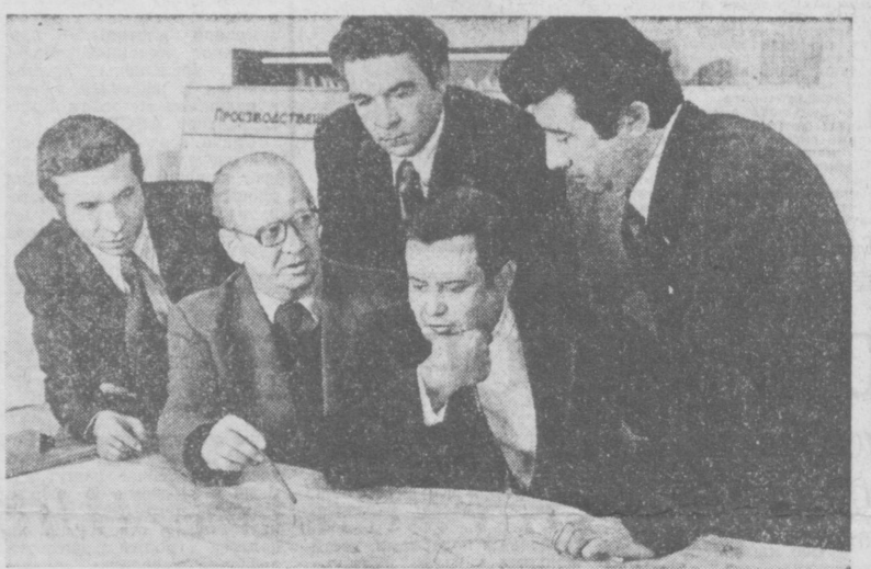
Отдел технических сооружений Ташкентского проектно-исследовательского института...