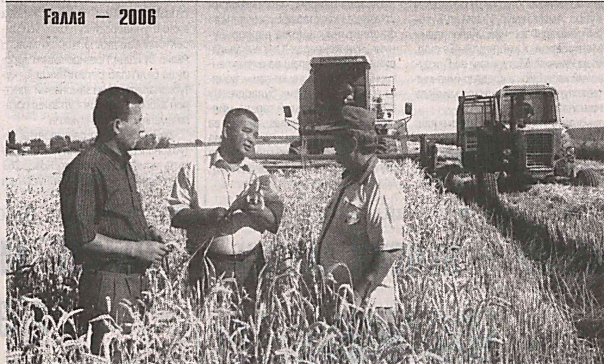
Ғалла — 2006

жамғарма Нукус ва Урганч шаҳарларини ичимлик суви билан таъминлаш лойиҳасини амалга ошириш учун қарийб 20 миллион АҚШ доллари миқдорига маблағ ажратган эди. Бугунги кунга қадар жамғарма томонидан Ўзбекистондаги лойиҳалар ижроси учун ажратилган маблағ миқдори 60 миллион АҚШ долларидан ошди. Оқсаройдаги учрашувда Ўзбекистон билан Кувейт Араб Иқтисодий тараққиёт жамғармаси ўртасидаги кенг қамровли ҳамкорлик алоқаларининг бугунги аҳволи ва истиқболлари юзасидан фикр алмашилди. (ЎЗА)