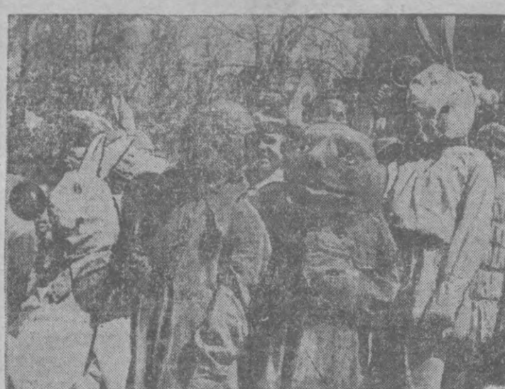
Это — герои из басни Крылова «Четверть» — осел, козел, марышка да козопый мышка, участвовавшие в детском балете-паравале 30 марта в ДКА.

Таашкентское курортное бюро приступило к реализации путевок на курорты Казахстана. Программа и условия конкурса можно получить у секретаря Правления ССА 3-го этажа.