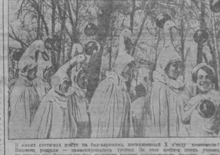
В каких костюмах пойти на бал-карикат, посвященный X съезду комсомола? Нарком просвещения — замаскироваться гусем! За этот костюм почти все ученики из школы им. Финкельштейна получили первую коллективную премию — крокет.

ОТ РЕДАКЦИИ. Возмутительнейший факт, сообщаемый в письме тов. Коф, должен привлечь внимание Джалалкудурского районного комитета партии. Райкому вообще следует заинтересоваться поставкой воспитательной работы в школах Джалал-Кулдува, ибо сигнал т. Коф — первый. Несколько подруг писем редакции выжидали в свое время районному отделу народного образования, который, очевидно, не чувствует ответственности за состояние воспитательной работы в сельских школах. Райкому и сельским комитетам также сообщать о безобразии, творимых в школах Джалалкудурского района. Ждем от него делового ответа.