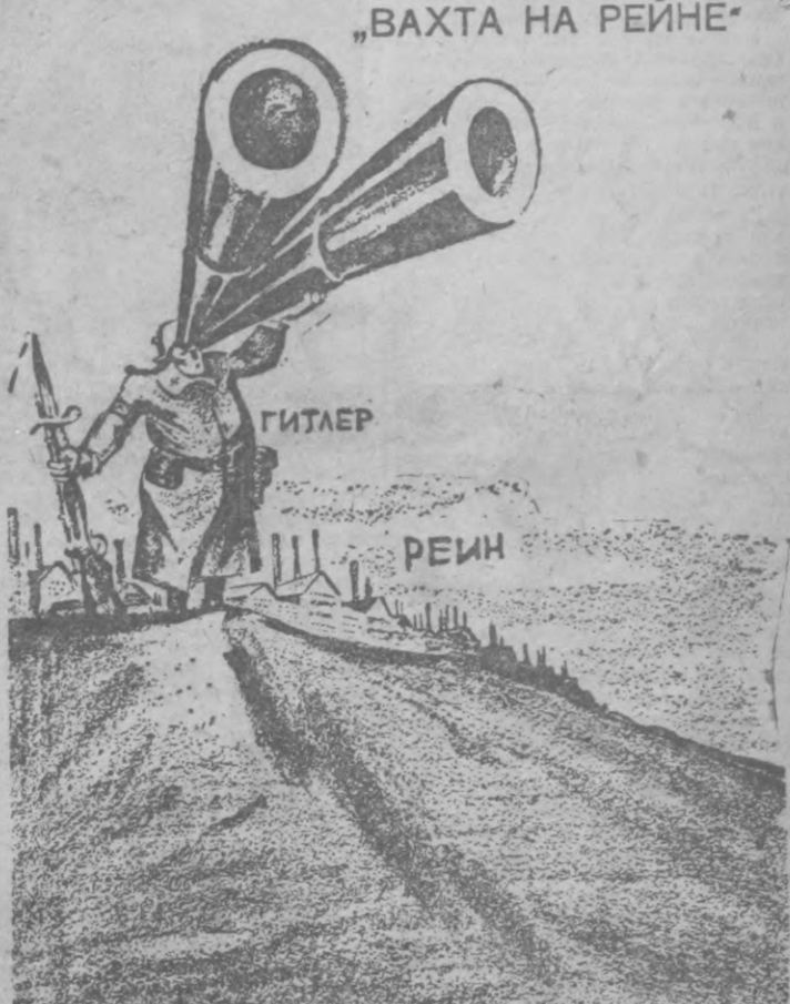
Готовясь к разбойничьим походам на восток, германский фашизм извращает жерла своих пушек и на запад. Рис. «Дейли уоркер».

ШАНХАЙ, 4 (УзТАГ). По сообщению печати, во многих провинциях Китая в последние два месяца умерло от голода более двух тысяч человек. В уезде Вейлинь есть тысячи сел, всю кору с деревьев и теперь едят корни. Жители отдельных деревень провинции Аньхуэй дерутся из-за трупов, которые являются единственным их питанием. Голодом охвачена вся провинция Шаньдун. Помещики, пользуясь этим, повышают цены на рис и пшеницу. Во многих районах страны происходят крестьянские бунты. В Кайфине — главном городе провинции Хэнань — 10 тыс. крестьян осаждают провинциальное правительство, протеста против повышения цен. Около тысячи голодающих из района Цзиньто провинции Цзянсу захватили несколько рисовых складов.