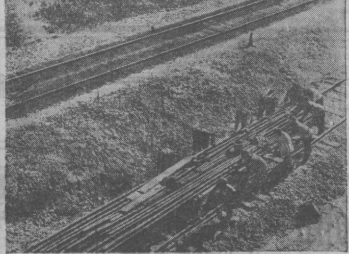
Бригада по ремонту железнодорожного пути перебрасывает рельсы на линию Чирчикстрой.