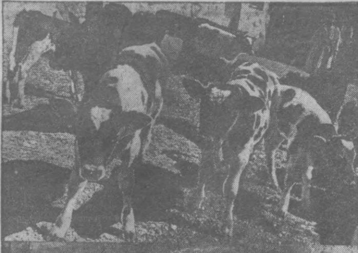
Первые чистопородные телата появились на свет в племенном совхозе «Красный водопой». На снимке (первый справа): го производителя «Вымпел».