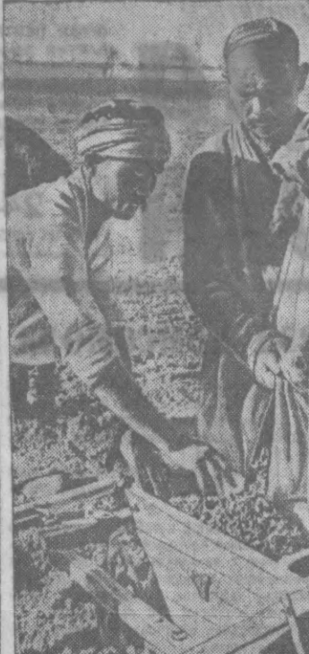
В поле по им. Икрамова. Инициативного района, является последние гектары хлопка. На снимке: охватывающий Икрамов и Икрамовых управляют связь семенами.