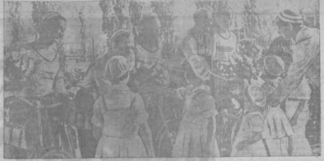
Юные динамовцы подносят цветы пятилетнему пути, чтобы поздравить 35.000 трудящихся Казахстана. В гостях у динамовцев — работники Казахстана. Дальнейший путь — на Чимкент и Алма-Ата.