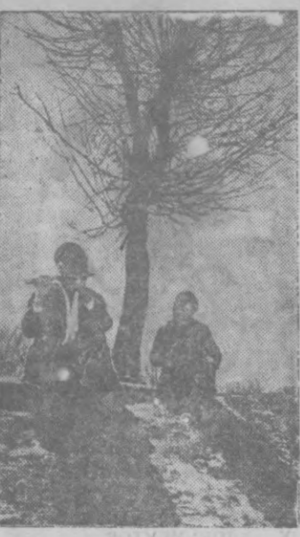
Весенняя песня. Октябрьский район Ташкента.