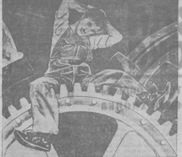
Государственное управление кино-фото промышленности (ГУКФ) приобрело фильмом известного американского кино актера и режиссера Чарли Чаплина «Огни большого города» и «Новые времена». На снимке: кадр из фильма «Новые времена».

Арита опровергал также сообщения японской печати о заключении тайного союза между Японией и Германией.