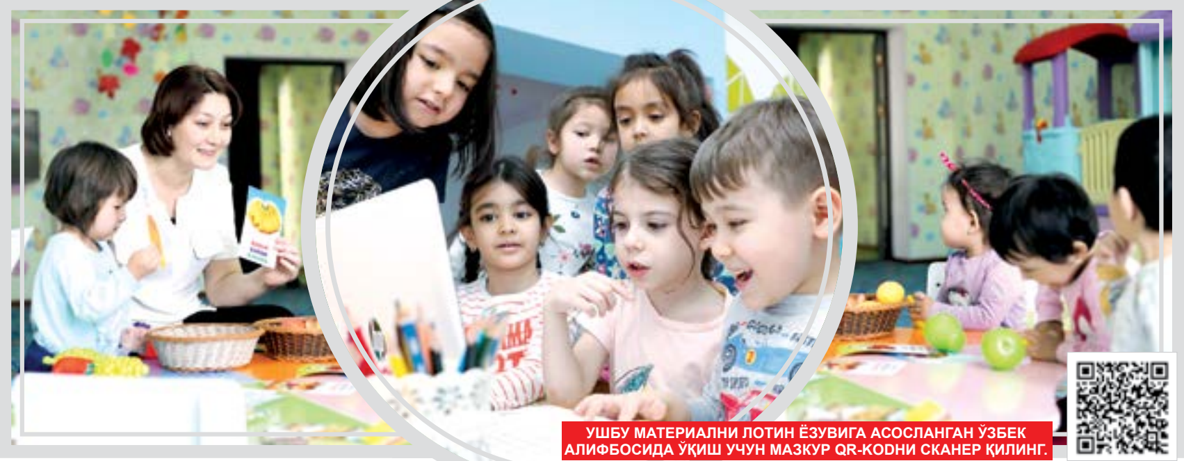
УШБУ МАТЕРИАЛНИ ЛОТИН ЁЗУВИГА АСОСЛАНГАН ЎЗБЕК АЛИФБОСИДА УҚИШ УЧУН МАЗКУР QR-КОДНИ СКАНЕР ҚИЛИНГ.

Тасаввур қилинг: оstonадан майда қадам ташлаб кириб келаётган фарзандингизнинг "Ойи, бугун мен беш баҳо олдим", деган хурсанд кийкириги сизни қанчалар қувонтиради. Уйингиз кўрчи бўлмиш фарзандингизнинг ҳар бир ютуғи кўксингизни тоғдек кўтарари. Зеро, ота-она учун фарзанд камолини кўришдан ортиқроқ бахт йўқ. Ҳа, мактабга таълим