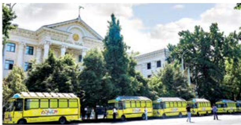
▶ Давоми 5-бетда