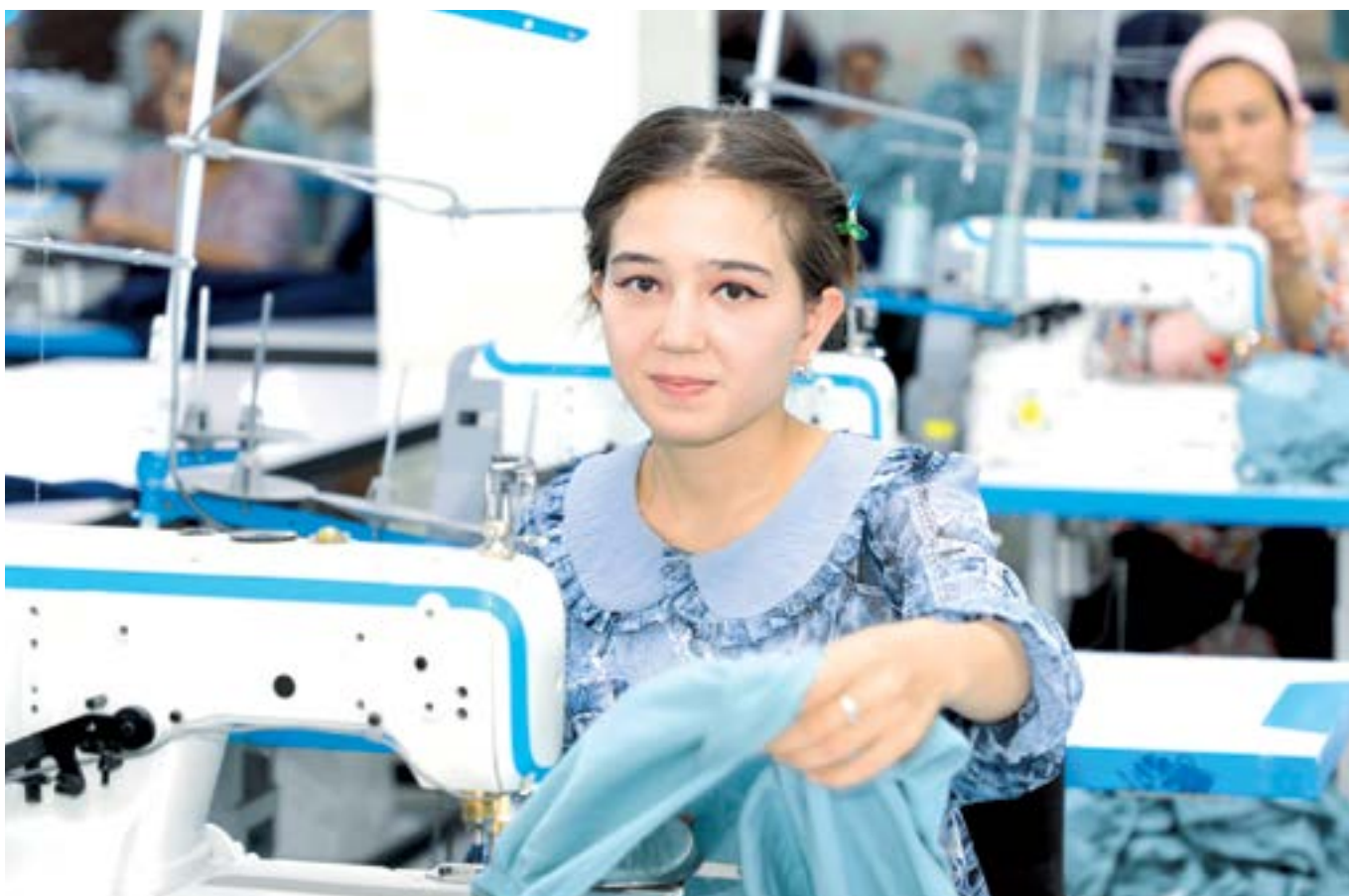
▶ Давоми 3-бетда

Кредит ва ер ажратиш, солиқ, транспорт логистикаси, экспорт, зарур инфраструктура — булар кичик бизнес ва хусусий тадбиркорликни ривожлантиришга хизмат қилувчи энг муҳим омиллар. Шу билан бирга, соҳа вакиллари кийнайдиган масалалар ҳам шу йўналишларга дахлдор. Айнан шу нуқтаи назардан, давлатимиз раҳбарининг тадбиркорлар билан юзма-юз, самимий суҳбатлашиши, фикр алмашиши, улар фаолиятидаги муаммо ва камчиликларга шахсан қизиқиб, ечим топиб бераётгани жуда эътиборга молик жиҳатдир.