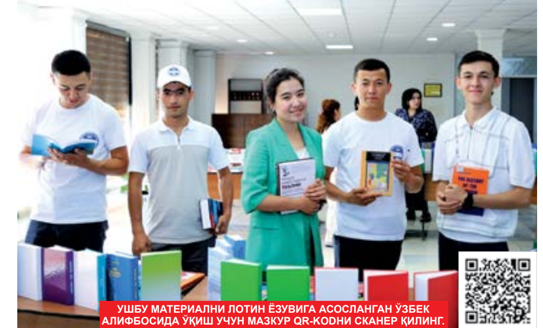
УШБУ МАТЕРИАЛНИ ЛОТИН ЁЗУВИГА АСОСЛАНГАН ЎЗБЕК АЛИФБОСИДА УҚИШ УЧУН МАЗКУР QR-КОДНИ СКАНЕР ҚИЛИНГ.

Халқимиз ижтимоий тараққийта интилиши ва чўқур маънавий салоҳияти билан янги Ўзбекистонни барпо этмоқда. Замонавий шароитда мамлакатимизда жамият ва инсон фаровонлиги, ижтимоий-маънавий тақомиллини таъминлаш борасида муҳим, ўз навбатида, юксак марра қўйилиб, ёруғ истиқболни кўзлаган чора-тадбирлар олиб боришмоқда. Узани ўзи ривожлантиришга қодир шахсни шакллантириш, бугун олаётган ҳар нафасини шу эл, шу халқ тинчлиги, давлат тараққийти учун сафарбар қилиш, умуман, кечаги натижа, кечаги қараш ва мезонлар бугун тарихга айланди, деб ҳисоблашни даркор. Шу вақтга қадар эришган ҳар қандай марраларимиз бизни қониқтирмаслиги ҳамда мана шу уй-фикрларимизни миллий феноменга айлантирмоғини давр талабидир.