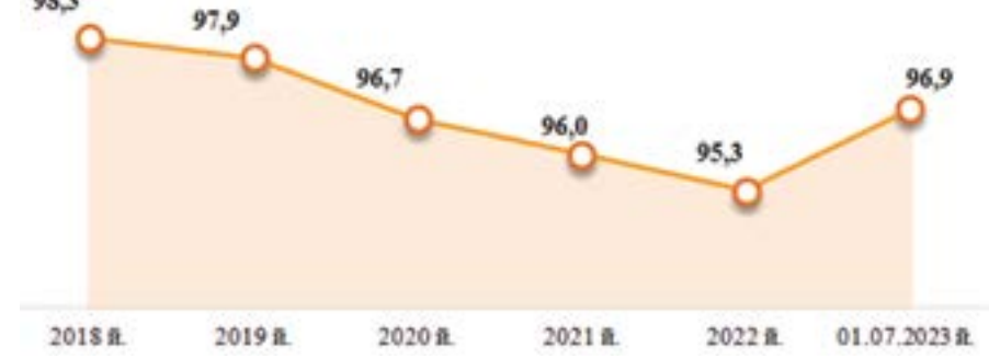
Кичик бизнес ва хусусий тадбиркорликнинг қишлоқ ҳўжалиғи маҳсулотлари етиштириш ҳажмидаги улуши, фоизда.

Тадбиркорлар ҳар томонлама қўллаб-қувватланаётгани, кўплаб бюрократик тўсиқларга барҳам бергани