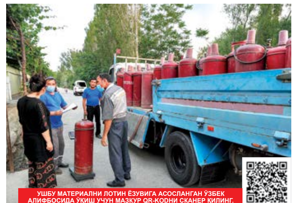
УШБУ МАТЕРИАЛНИ ЛОТИН ЁЗУВИГА АСОСЛАНГАН ЎЗБЕК АЛИФОСИДА УҚИШ УЧУН МАЪҚУР QR-КОДНИ СКАНЕР ҚИЛИНГ.

Шу билан бирга, маҳалла раисларининг халқ олдидаги масъулияти ва жавобгарлиги аниқ белгиланади. Одамларнинг ишончини қозонмаган маҳалла