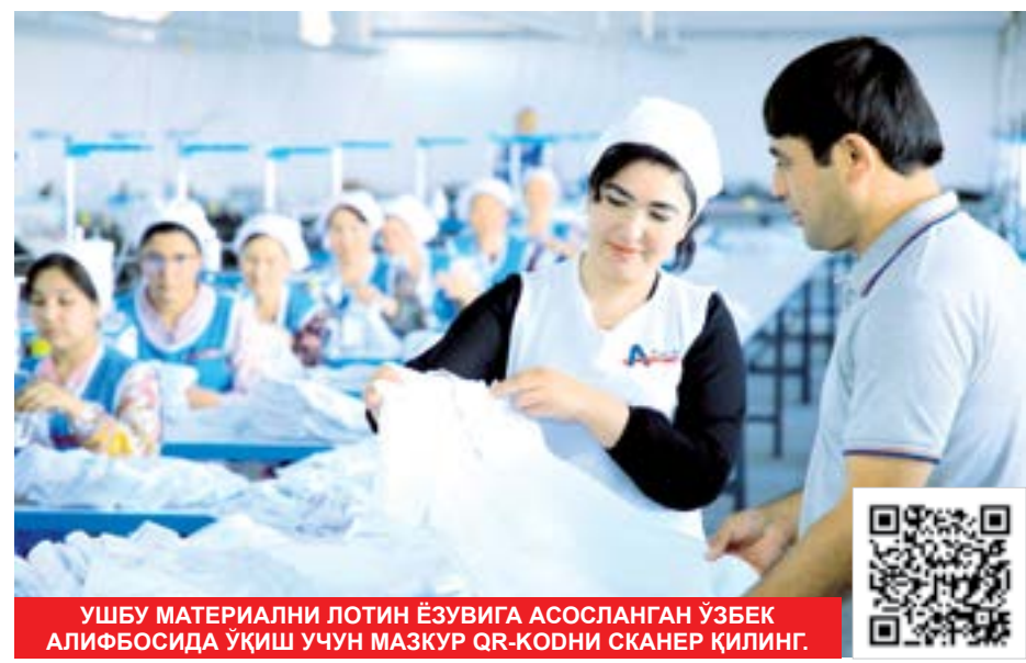
УШБУ МАТЕРИАЛНИ ЛОТИН ЁЗУВИГА АСОСЛАНГАН ЎЗБЕК АЛИФБОСИДА ўқиш учун МАЗКУР QR-КОДНИ СКАНЕР ҚИЛИНГ.

Маъмурий жавобгарлик тўғрисидаги кодексга киритилган янги моддага кўра, тадбиркорлик субъектлари банк ҳисобварақларидан пул маблағларини уларнинг розилигисиз қўнунга хилоф равишда ўтказиш ёки олиб қўйиш ёхуд ортиқча ундирилган пул