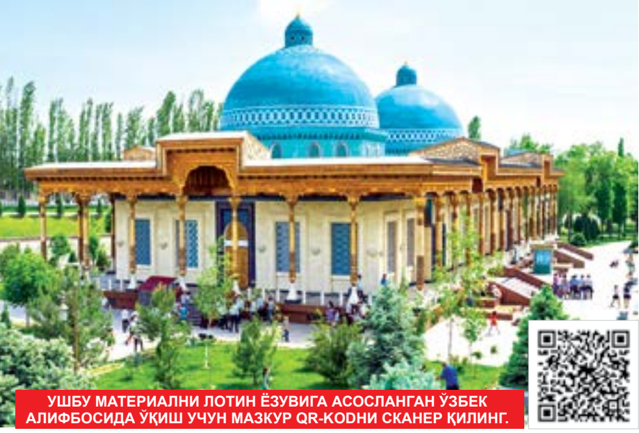
УШБУ МАТЕРИАЛНИ ЛОТИН ЁЗУВИГА АСОСЛАНГАН ЎЗБЕК АЛИФБОСИДА ЎҚИШ УЧУН МАЗКУР QR-КОДНИ СКАНЕР ҚИЛИНГ.