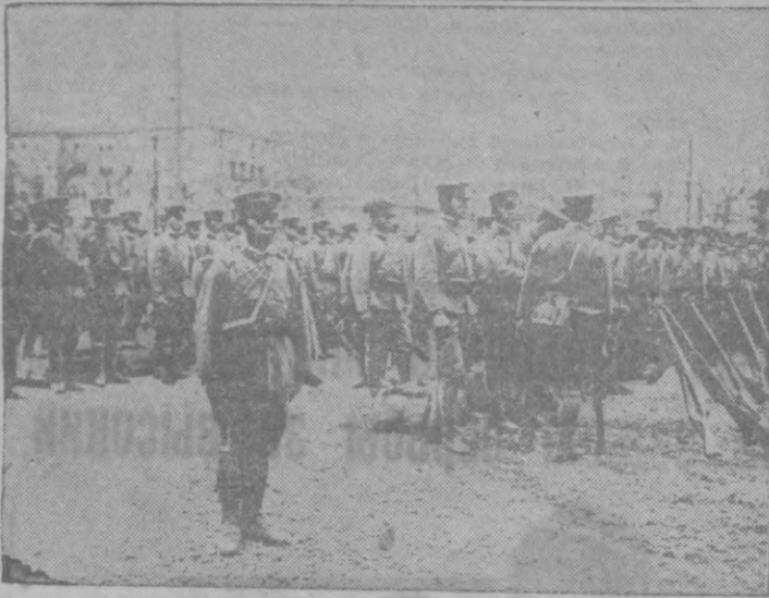
НОВЫЕ ПОДКРЕПЛЕНИЯ ЯПОНСКИХ ВОЙСК В МАНЧЖУРИИ. На снимке: отряд студентов японской академии, отправляющийся на Тонкин в Манчжурию.

ШАНХАЙ, 25 (УТАГ). Чан Кай-ши и военный министр Хо Ин-ши выехали в Ханчжоу (Хубэй) в связи с создавшейся там чрезвычайной напряженной обстановкой.