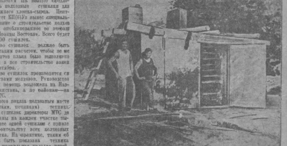
В колхозе им. Ибрамова, Ордонкижневского района построены сушилки хлопка по проекту инженера Семенова. Испытания дали хорошие результаты. На снимке: общий вид колхозной сушилки.

Ньюский цехов ЦК ВВП(б) предложит построить колхозные сушилки для просушки влажного хлопка-сырца. Центральный Комитет ЦК ВВП(б) вынес специальное постановление о строительстве колхозных сушилок; опубликованное во вчерашнем номере «Правды Востока». Всего будет построено 3.300 сушилок.