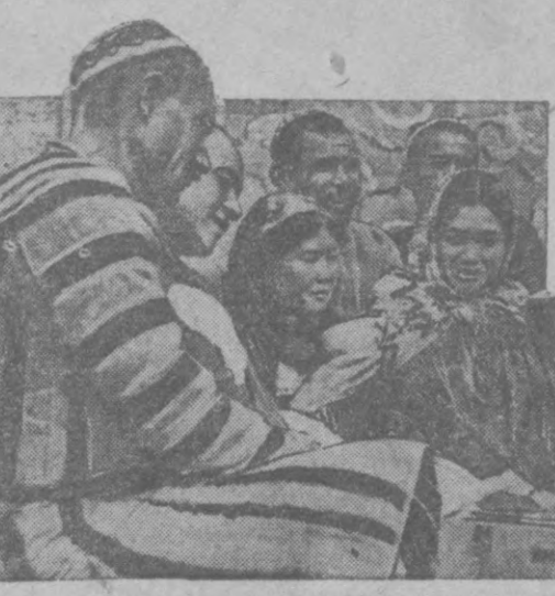
Колхозники артиля «Хавикат Узбекистана» (Куйбышевский район) после работы огулают новую патентованную пластмассу в колхозной красной чайхане.

Так же медленно и вяло работают и бригады Исмаила Усманова, Кайдарбай Захидов, иногда в жилах не работающих по ливальничью, и поспешный на эту ответственную работу по безопасности функционеров хлопка, пускал воду сильными потоками, смыв хлопчатник. Долгательник на срезки также не имеет представления о том, как полоть, и в результате часть хлопка остается без воды, а часть — сорночисто.