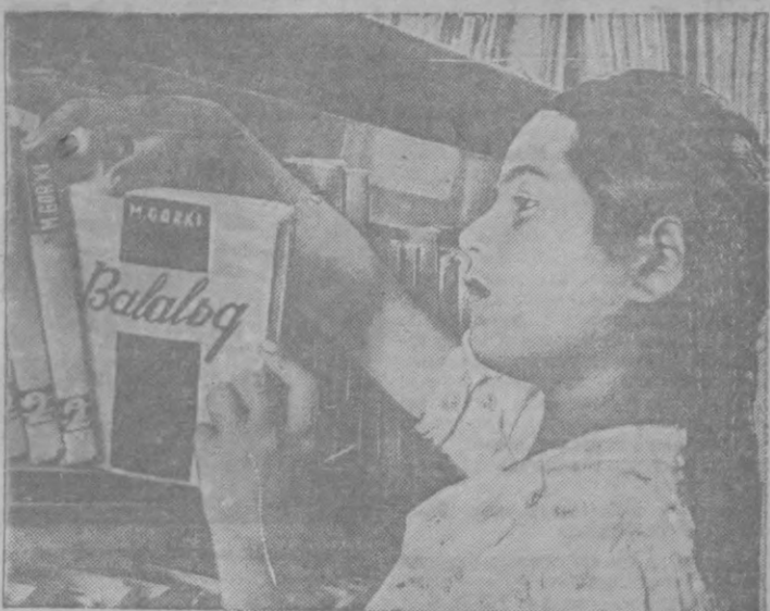
ПАМЯТИ А. М. ГОРЬКОГО. Юная активная читательница библиотеки женского профсоюза Ташкентской Раифонки выбрала себе книгу для чтения — «Детство» Горького.

На сельхозработе измалено 35 человек художников-рабочих, но они ничего не делают из-за отсутствия материалов.