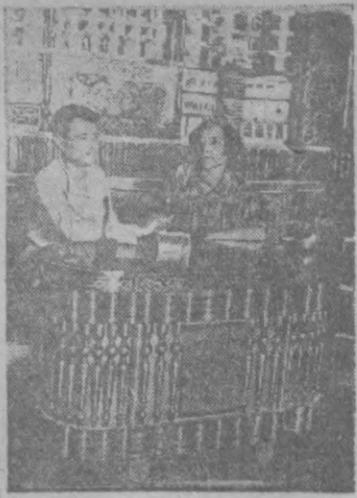
Открыл новый магазин табачных изделий.