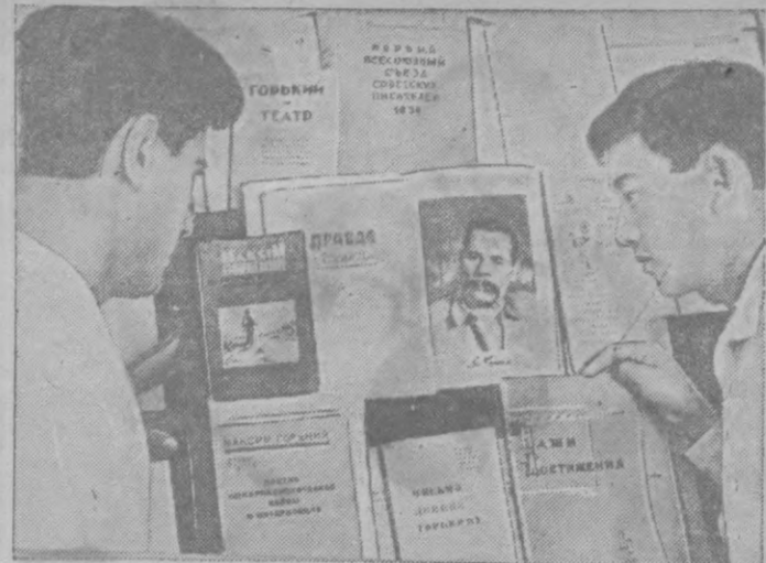
ПАМЯТИ А. М. ГОРЬКОГО. В Ташкентской публичной библиотеке организована выставка книг произведений великого русского писателя А. М. Горького.