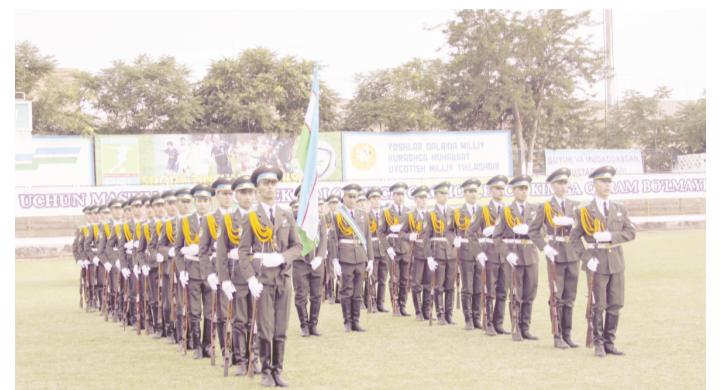
Чирчиқдаги "Кимёгар" ўйингоҳида Халқаро гиёҳвандликка қарши кураш куни муносабати билан "Ёшлар соғлом турмуш тарзи тарафдори" фестивали бўлиб ўтди. Ташкилотчилар – "Камолот" ЁИҲ ва Чирчиқ шаҳар ҳокимлиги фестивални ёрқин байрам шousига айлантириш учун бор имкониятларини ишга солганлари тadbир давомида кўзга аққол ташланиб турди.