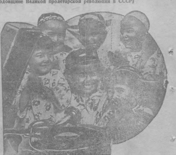
В детсадах колхоза имени Карла Маркса, Ленинского района.