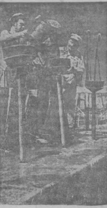
Заливка цементам плотины головного узда Чирчикстроя.