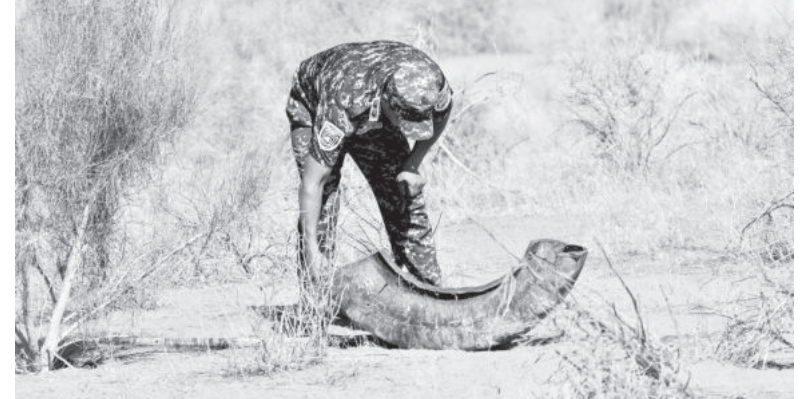
«Окончание. Начало на 1-й стр.»

Государственный заповедник «Ақтау-Тамды» общей площадью 40 тысяч гектаров создан в Тамдынском районе Навоийской области с целью охраны уникального природного комплекса и объектов в южной части пустыни Кызылкум (одной из крупных пустынь Туранского равнин), а также редких исчезающих животных и птиц, растений и их ареала обитания.