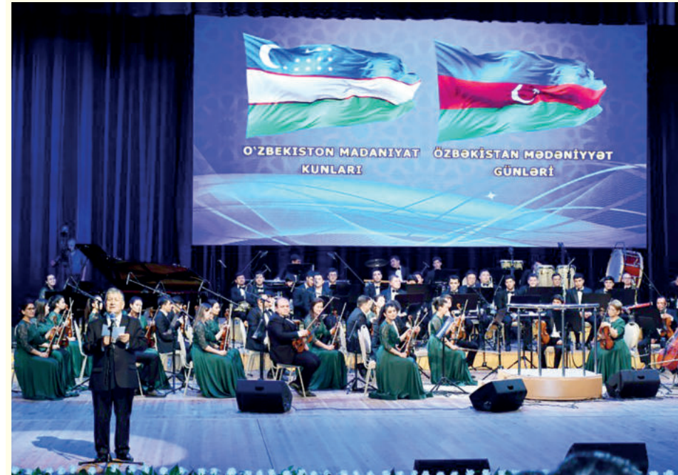
Начало на 1-й стр.

Между нашими странами с давних времен установлены культурные связи. Два народа, вдохновляясь культурами друг друга, обогащают схожие традиции.