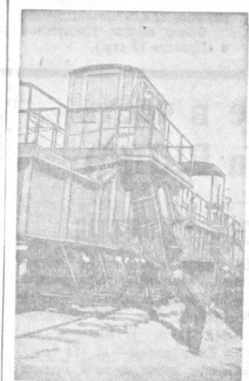
Подъем пути на станции Сальково Сталинской железной дороги, при помощи балластной машины, изготовленной на тульском заводе НКПС.

Вест о созвье XVII партсъезда вывала большой творческий подъем среди коллектива работников Центральной селекционной станции СоюзНИИХ в Ташкенте.