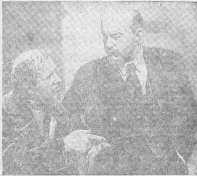
Кадр из фильма «Ленин в 1918 году». Слева: беседа Сталина и Ворошилова в вагоне. В роли Н. В. Сталина — артист-орденоносец М. Г. Геловани, в роли К. Е. Ворошилова — заслуженный артист РСФСР Н. И. Боголюбов. Справа: беседа Ленина с кулаком. В роли В. И. Ленина — народный артист СССР орденносец Б. В. Щукин, в роли кулака — заслуж артист РСФСР Н. С. Плотников.