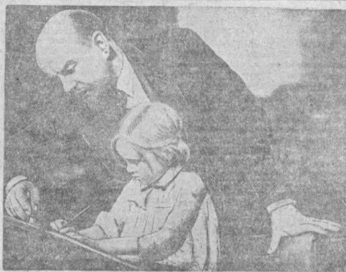
Кадр из фильма «Ленин в 1918 году». Ленин с девочкой. Роль В. И. Ленина исполняет народный артист СССР орденносец Б. В. Щукин.

го обаяния. Щукин показывает нам многогранного, сложного и глубокого образ Ленина.