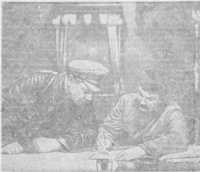
Кадр из фильма «Ленин в 1918 году». Слева: беседа Сталина и Ворошилова в вагоне. В роли Н. В. Сталина — артист-орденоносец М. Г. Геловани, в роли К. Е. Ворошилова — заслуженный артист РСФСР Н. И. Боголюбов. Справа: беседа Ленина с кулаком. В роли В. И. Ленина — народный артист СССР орденносец Б. В. Щукин, в роли кулака — заслуж артист РСФСР Н. С. Плотников.