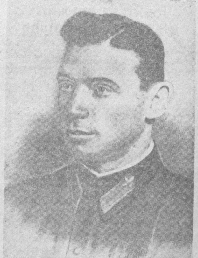
Герой Советского Союза В. К. Коккинин.