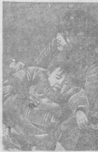
Варварские бомбардировки японской авиации линкуют прова тысячи мирных жителей Китая. На снимке: жемчужина с ребенком, оставшаяся без своего жилища в результате японской бомбардировки родного города.

Собрание партийного актива уверено, что ташкентская городская парторганизация, вооруженная реченьями XVIII съезда ВКП(б), под руководством ЦК КП(б)У, тесно сплоченная вокруг Ленина-Сталина, будет неуклонно и успешно выполнять генеральный план и превратит Ташкент в красивый, подлинно социалистический город, который столицей трудящегося Узбекистана — могучего форпоста коммунизма на Востоке.