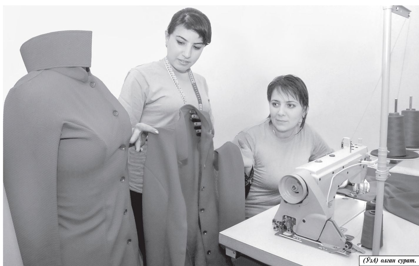
(ЎЗА) огаин сурат.

лат дастурида белгилаб берилган устувор йўналишлар ижросини таъминлаш борасида қизгин фаолият олиб борди. Хусусан, иш билан бандликни ошириш, кичик бизнес ва хусусий тадбиркорлик фермерликни янада ривожлантириш, оилаларни мустақамлаш ҳамда аёлларни иқтисодийнинг турли тармоқлари ва соҳаларидаги фаолиятини муносиб рағбатлантириш, уларнинг ўз иқтидорини намоеён этиши ва уй-рўзгордаги ишларини энгиллаштириш учун қулай ижтимоий маиший шароитлар яратиш чора-тадбирларини амалга ошириш асосий йўналишлардан бири ҳисобланади. Аҳолининг турмуш даражасини яхшилаш, сифатини ошириш, ижтимоий соҳа муассасаларининг моддий-техник базасини мустақамлаш ва ишини яхшилаш мақсадида, “Обод турмуш йили” Давлат дастури тадбирларини фаол амалга оширишни таъминлаш чора-тадбирлари доирасида