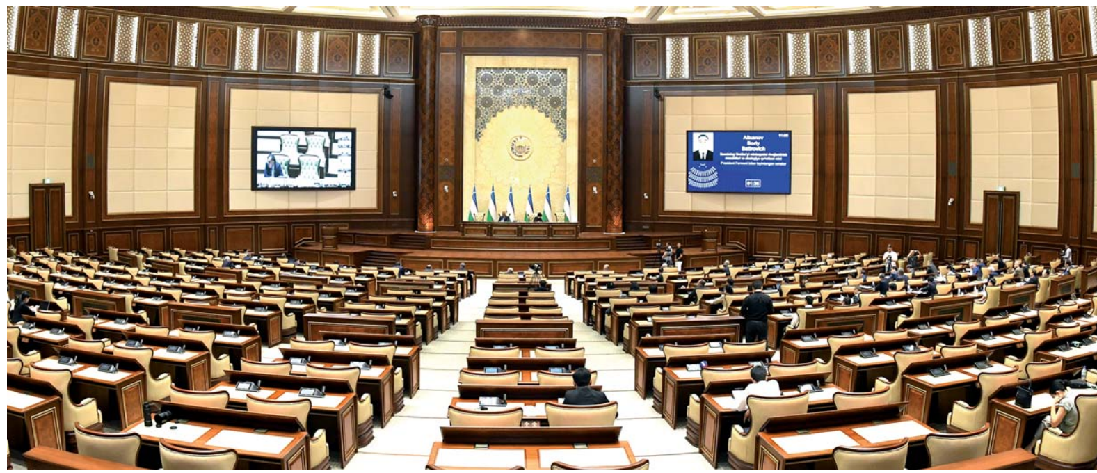
Фото С. Вохидова.

о сорок четвертом пленарном заседании Сената Олий Мажлиса Республики Узбекистан