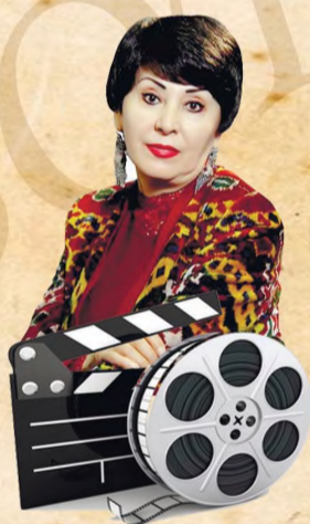
Гавҳар Зокирова, Ўзбекистон халқ артисти:

– “Тўйлар муборак” менинг биринчи кинокартинам. Жамоага катта умид ва ҳаяжон билан кириб борганман. Раззоқ ака, Лола опа, Ғани ака... Уларнинг салобатлари босса керак, деган ҳадик бор эди. Кейин билсак улар жуда самимий, шогирдпарвар одамлар экан. Эсимда суратга олиш ишлари октябрь ойларида бўлган. Бешёғочдаги кўлнинг сувлари олиб ташланган эди. Айнан куёвни қидирадиган эпизод учун катта қўл сув билан тўлдирилган. Ўқувчилар мен қайси сахнани айтаётганимни аллақачон тушуниб олди. Оёғимда платформа деган туфли. 1978 йилда роса урфга кирган эди. Биринчи дублда сценарийда ёзилгандек мен костюм-шим билан қайикдан сувга йиқилиб тушдим. Иккинчи дублда костюм-шимсиз, лекин ўша туфлида “йиқилдим”. Учинчи дублда режиссёр: “Энди сувдан чиққанимда оғзингдан сувни пуркаб кейин гапир”, дедилар. Учинчи дублгача платформа туфлининг бўлари-бўлган, оғир, устига-устак мен совкотганман. Яна қайикдан “йиқилдим”. Ҳам чарчок, ҳам туфлининг оғирлиги мени сувнинг тагига тортиб кетган. Чўкиб кетишимга бир баҳа қолган. Зўрға куч тўплаб, қайикка ёпишганман. Ўша машҳур “шу ерда чўккан одамни кўрмадингизми?” деган эпизод мана шундай суратга олинган эди.