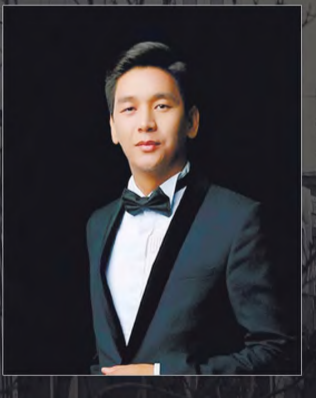
Жансшибек Пиёзов, Ўзбекистон халқ артисти:

1968 йилда ҳозирги Ўзбек Миллий академик драма театри ҳам шу кўчага кўчириб ўтказилгани осимда. Уйим театрга яқин бўлиши учун мен ҳам шу манзилни танлаганман. Ҳозир уйим театрнинг рўнасида, театрга ким кириб-чиқаятигача яққол кўриниб туради. Жуда кўп ҳамкасбларим менга ҳавас қилишпади. Айниқса, ҳозирги тирбандликлар кўнайган бир вақтда автоматинасиз пиёда ишга чиқаман. Кўчамиздаги қулай тураргоҳлар, тартибли йўл ҳаракатининг йўлга қўйилганлиги мени хурсанд қилади. Ишхонам ёнимда, озгина юрсангиз “Халқлар дўстлиги” санъат саройи, “Ўзбекистон” наприёти, Киносарой, хибонлар, қисқача қилиб айтганда, санъат одами учун энг қулай яшаш жойи. Лекин, бу кўчада озик-овқат дўконлари камлиги сабабли узокроқдан рўзгор қиламиз. Яна банк қурилса, маиший хизматларни кўпайтиришса айни муддао бўлар эди.