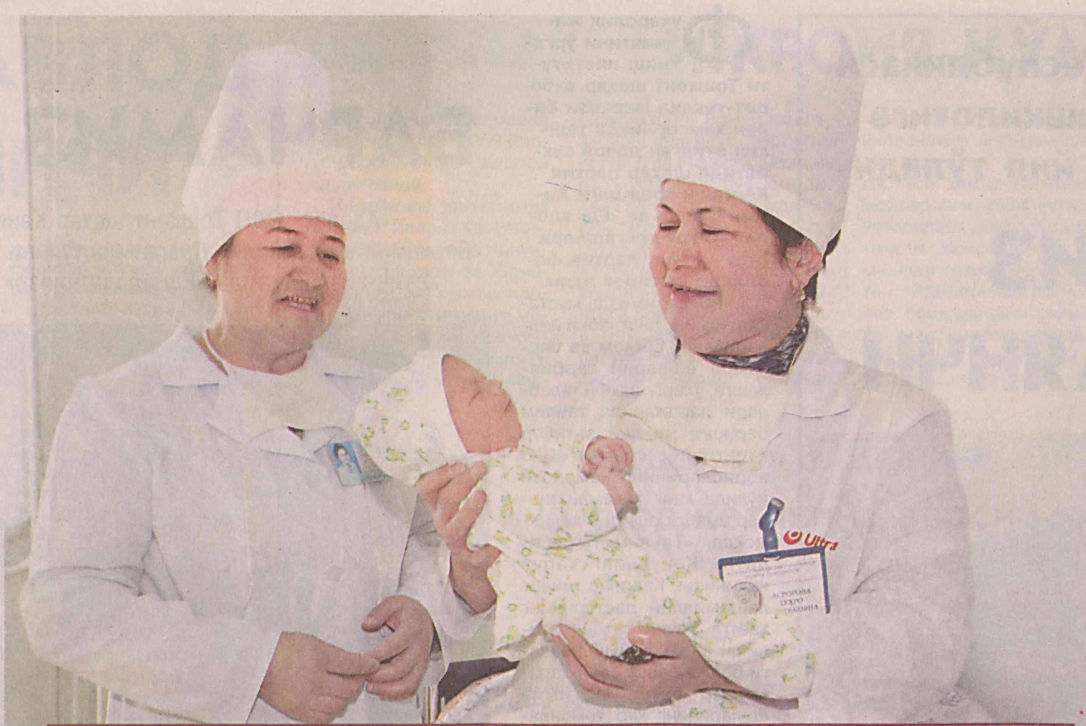
Юртбошимиз раҳнамолигида тиббий соҳада амалга оширилаётган ислохотлар ўз самарасини бераётир. Замонавий тиббиёт муассасалари, айниқса қишлоқ врачлик пунктлари аҳолига малакали тиббий хизмат кўрсатмоқда. Фарғона туманида ҳам мазкур йўналишда салмоқли ишлар олиб борилмоқда.