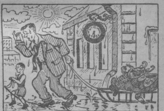
(Изюшка А. Майляца).