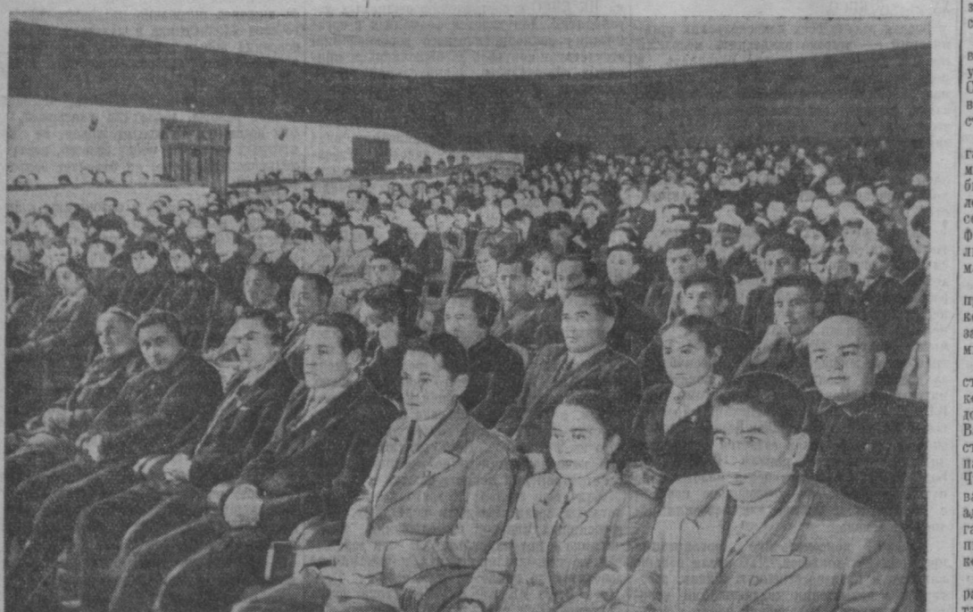
На снимке: в зале заседаний XV съезда комсомола Узбекистана.

А. РЯБОВ, Я. НУДЕЛЬМАН. (Спец. корр. «Правды Востока»).