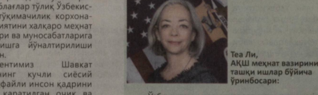
Тea Ли, АҚШ Меҳнат вазирлигининг таққи ишлар бўйича ўринбосари:

– Ўзбекистонда кластерлар кўринишидаги вертикал интеграция орқали пахта билан боғлиқ барча жараён шу ернинг ўзида амалга оширилишига имкон бор. Бунда пахта етиштирувчилардан тортиб то охириги маҳсулот тайёр бўлгунча жараёнларда тўла шаффофлик ва кузатувчанликка эришиш мумкин. Бу жуда ноёб ҳодиса ва халқаро ҳамжамиятнинг ўзига жалб қила олади. Кластерлар уюшмаси эса, бу албатта, яхши, у орқали кўплаб иш ўринлари яратиш, қолаверса, пахта сановатида ишловчиларнинг ҳаётини яхшилаш олиш мумкин.