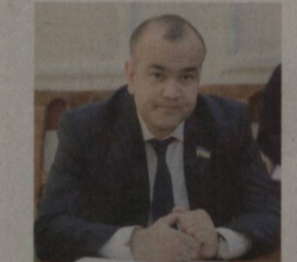
Нодир ЖУМАЕВ, Олий Мажлис Қонунчилик палатаси депутати, иқтисодиёт фанлари доктори, профессор

2022 йилнинг 10 март санаси ўзбек пахта-тўқимачилик соҳасида тарихий ғалабага эришилган кун сифатида ёдимиздан ўчмайди. Сабоби, ўша кун «Cotton Campaign» халқаро коалицияси томонидан ўзбек пахта-сига нисбатан бойкот бекор қилинди. Айни чоғда, бу болалар меҳнати ва мажбурий меҳнатга буткул барҳам берилгани жаҳонда тан олинганнинг ёрқин тасдиғи бўлди. АҚШ Меҳнат вазирлиги томонидан тўқимачилик