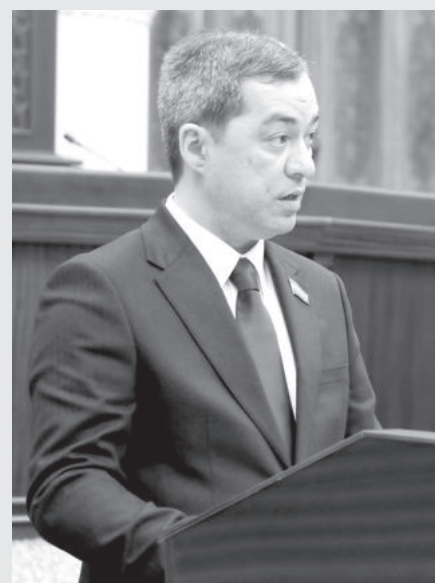
Санжар Хамидуллаев. Депутат Законодательной палаты Олий Мажлиса Республики Узбекистан.

Особое внимание к среднему бизнесу актуализируется его уникальную ролью в обеспечении устойчивого экономического роста страны, во внедрении инновационных технологий, в развитии конкуренции, увеличении экспорта, решении вопросов импортозамещения. Сегодня в республике в рамках реализации масштабных инвестиционных проектов создано и успешно действует около десяти тысяч высокотехнологичных предприятий, относящихся к категории субъектов среднего бизнеса.