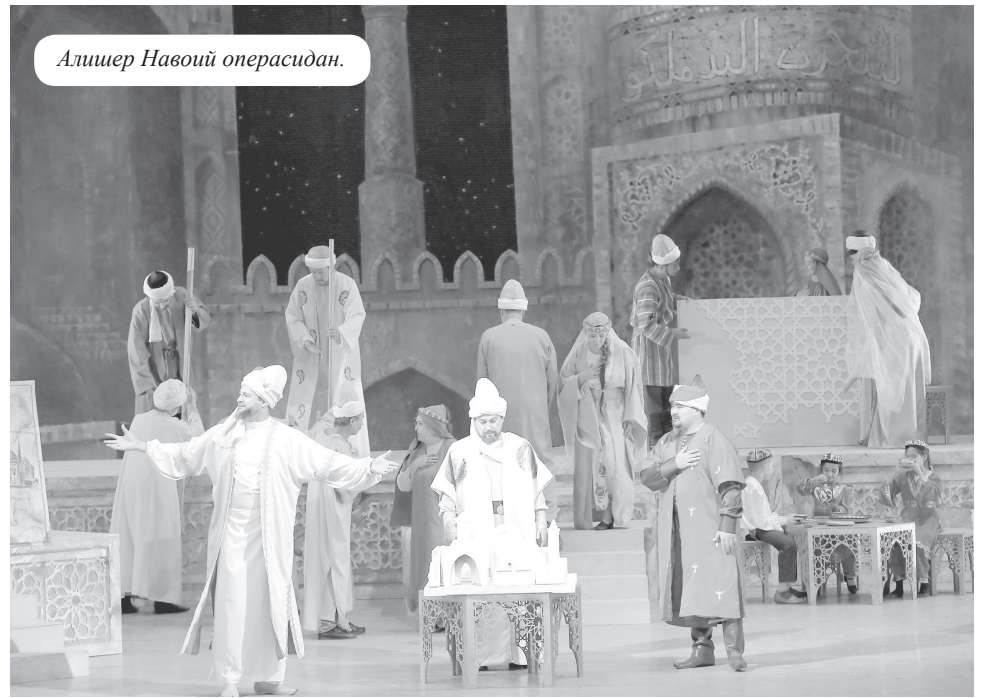
Алишер Навоий операсидан.

Янги шаклдаги театрини яратишга киришган жадидларда анъанавий театр томошаларига нисбатан икки хил қараш мавжуд эди. Айрим жадидлар халқ майдон театрини бутунлай инкор этишди. Гўё махсарабоз ва кизиқчилар санъати улар қўтариб чиққан ғояларга зид ва тамойила қарама-қаршидай талқин этилди. Бошқа жадидлар эса, ақинча, европа театри неъматлари ҳозирча ўзбек томошабиниға тушунарисиз эканлигини таъкидлашди. Бу қараш “Туркистон” газетасининг 1922 йил 22 сентябрь сониде эълон қилинган “Ўзбек театруси” номли мақолада ифодасини топган эди. Мақолада шундай ёзилади: “Бизнингча, бунинг сабаби ёлғиз санъаткорликдир. Халқимиз ҳозирда ингичка санъатлар истамайди. Театрларга келганда ҳам фақат томошо, кўнгул очиш учун келадир. Унга ўн беш минутлик бир ўйин учун бир-икки соат декоратсия куруш билан овқара бўлмоқ ҳеч ёқмас. Бу ҳол табиийдир. Санойић нафиса, ўйин-қулги ва диққатни ўзига жалб қилгучи ҳолатлар билан халқнинг ҳиссига таъсирли