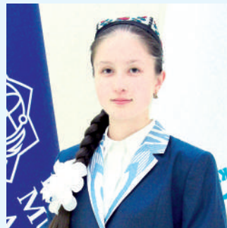
Қишлоқ томон олсанг йўл, Бизниқиди меҳмон бўл!

Дўстлашайлик бойчечак, Чиройлигим, ой чечак.