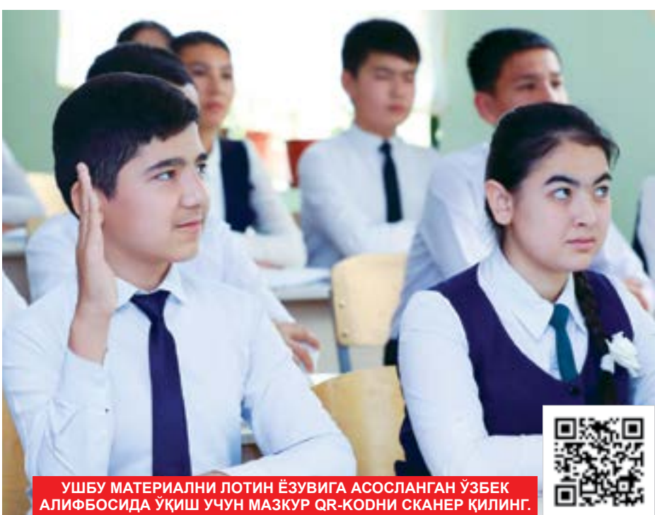
УШБУ МАТЕРИАЛНИ ЛОТИН ЁЗУВИГА АСОСЛАНГАН ЎЗБЕК АЛИФБОСИДА ЎҚИШ УЧУН МАЗКУР QR-КОДНИ СКАНЕР ҚИЛИНГ.